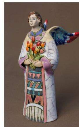
Горчакова Светлана «Ангел с цветами». 2015 г. Керамика, глазури. h-24 см г. Омск