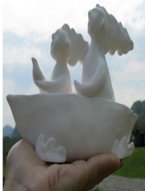
Горчакова Светлана «Млечный путь», 2017 г. Фарфор, бисквит. h-11 см г. Омск