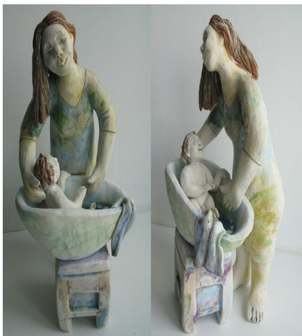
Горчакова Светлана «Купание малыша», 2015 г. Керамика, ангобы, оксиды, глазури, стекло. h-19 см г. Омск