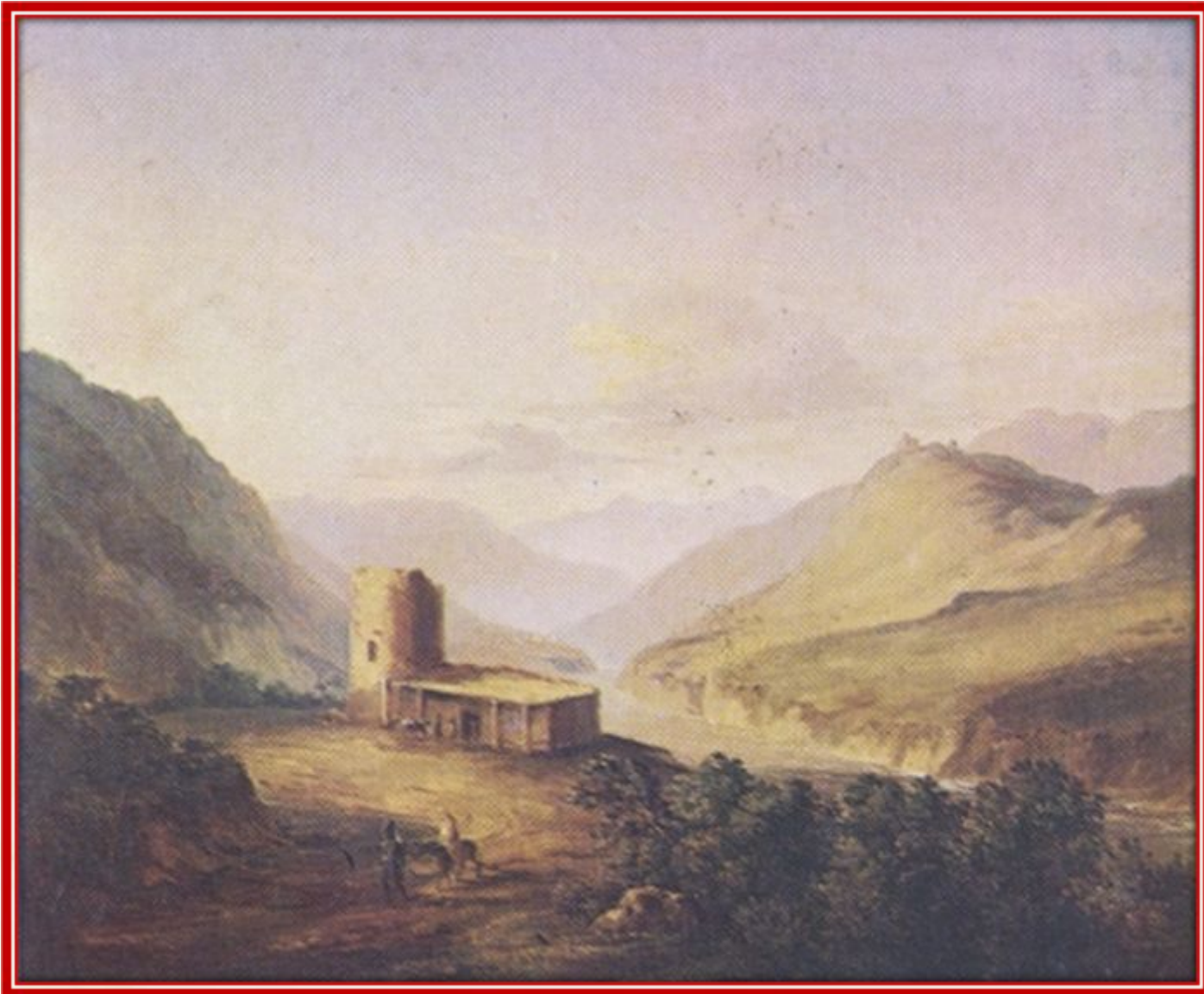
Военно-Грузинская дорога близ Мцхета. Масло. 1837 г.