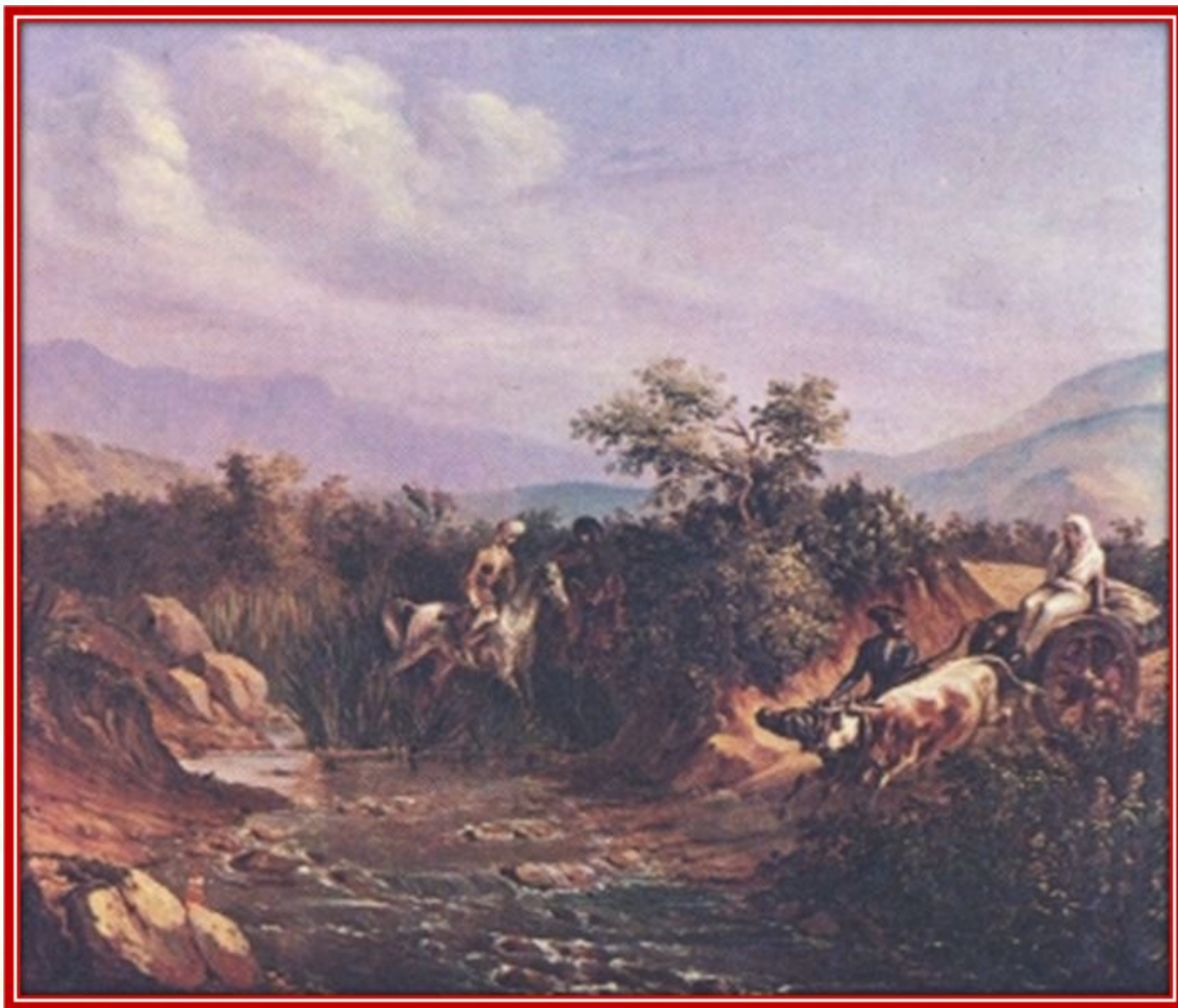
Сцена из кавказской жизни. Масло. 1838 г.