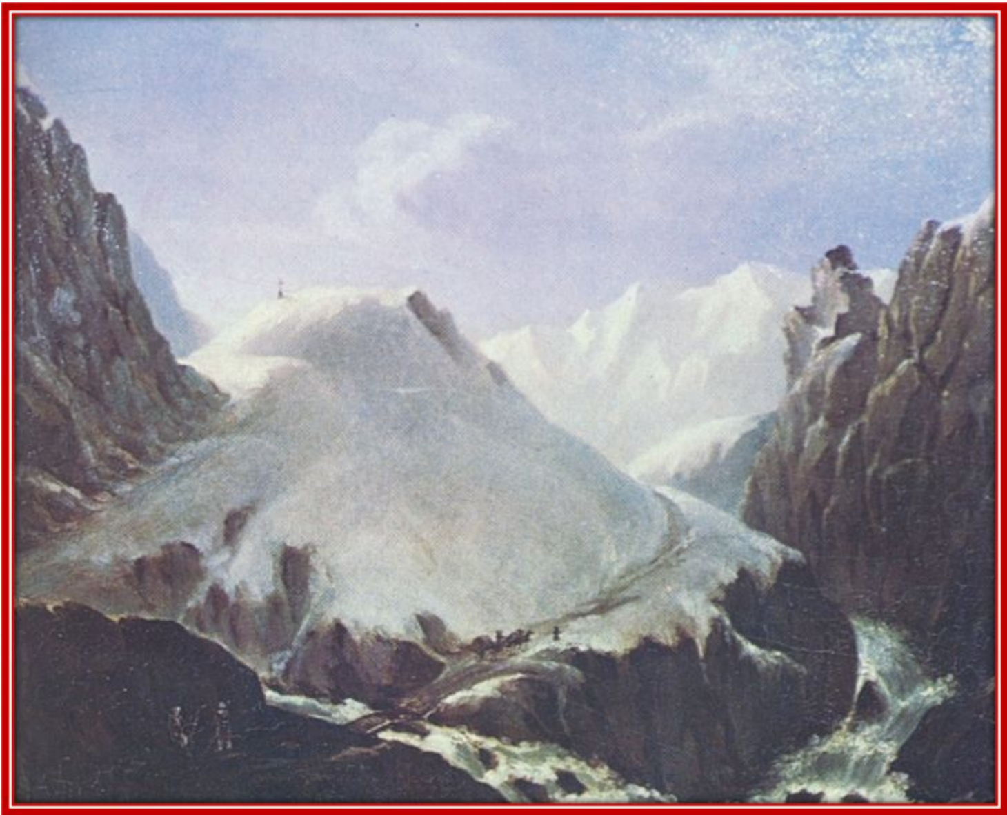
Крестовый перевал. Масло. 1837—38 г