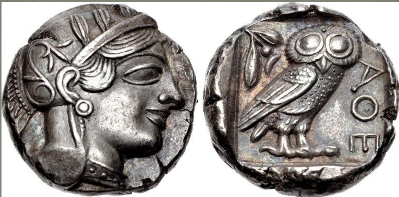
Афинская тетрадрахма, V в. до н. э.