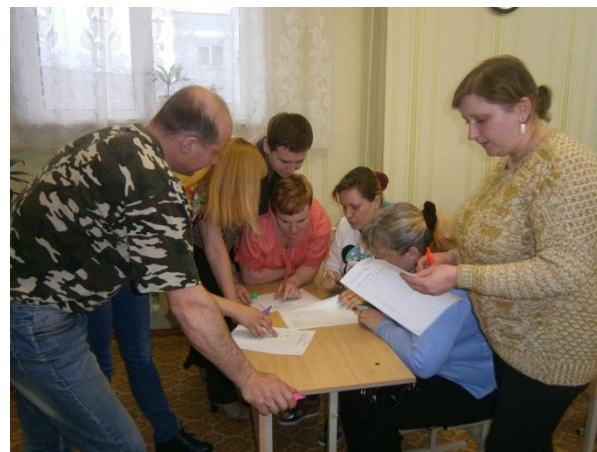
Групповая работа на тренингах