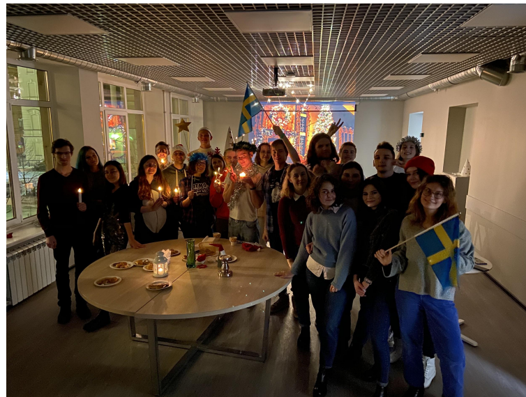
На фото праздник Святой Люсии 2020 (СПбГЭУ, СПбГУ, ИТМО)