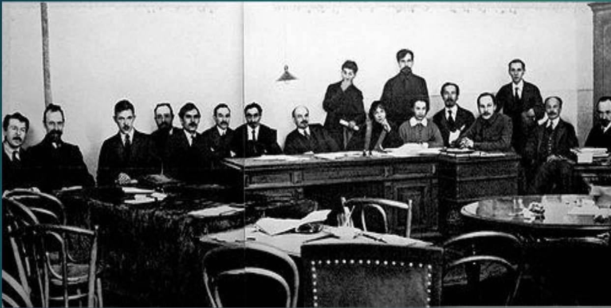
СНК РСФСР (1918-1946)