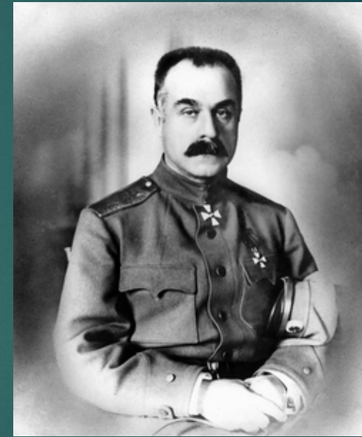
Алексей Максимович Каледин (1861-1918) – русский военачальник, генерал от кавалерии, войсковой атаман Дона, деятель Белого движения.