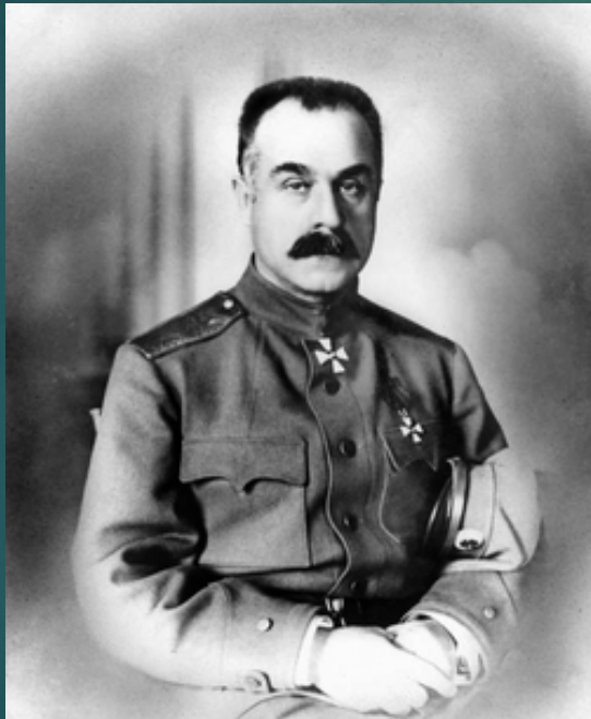
Генерал от кавалерии Алексей Максимович Каледин