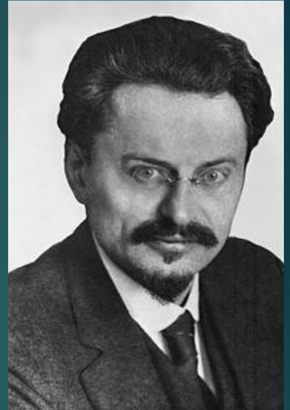
Лев Давидович Троцкий