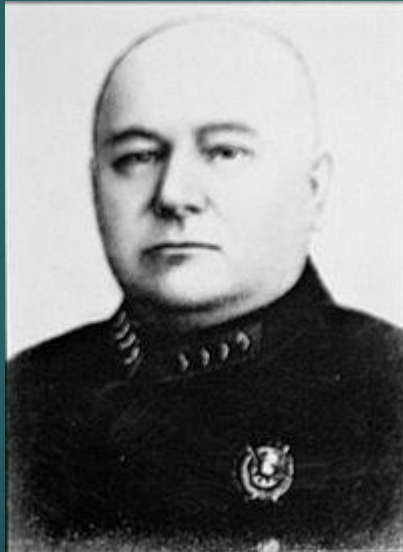
Иоаким Иоакимович Вацетис