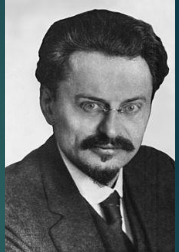
Лев Давидович Троцкий