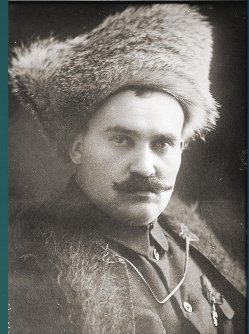
Атаман Григорий Михайлович Семёнов