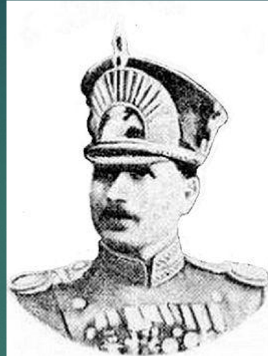
Михаил Артемьевич Муравьев (1880-1918) – офицер Русской императорской армии, революционер (эсер), командир отрядов Красной гвардии и Красной армии.