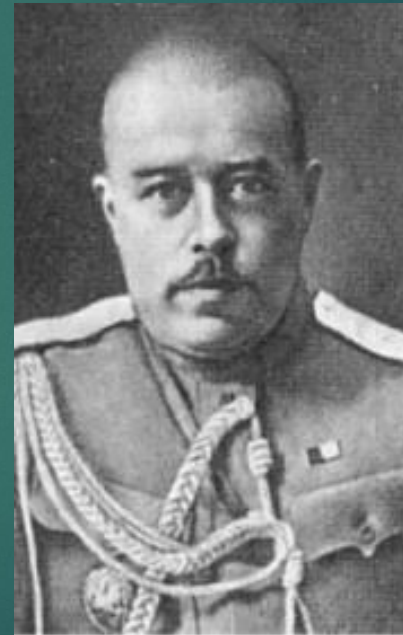
Полковник Александр Ильич Дутов