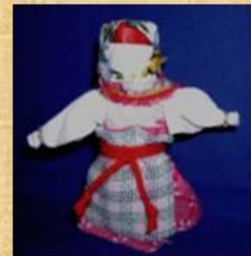
Владимирская столбушка на бересте