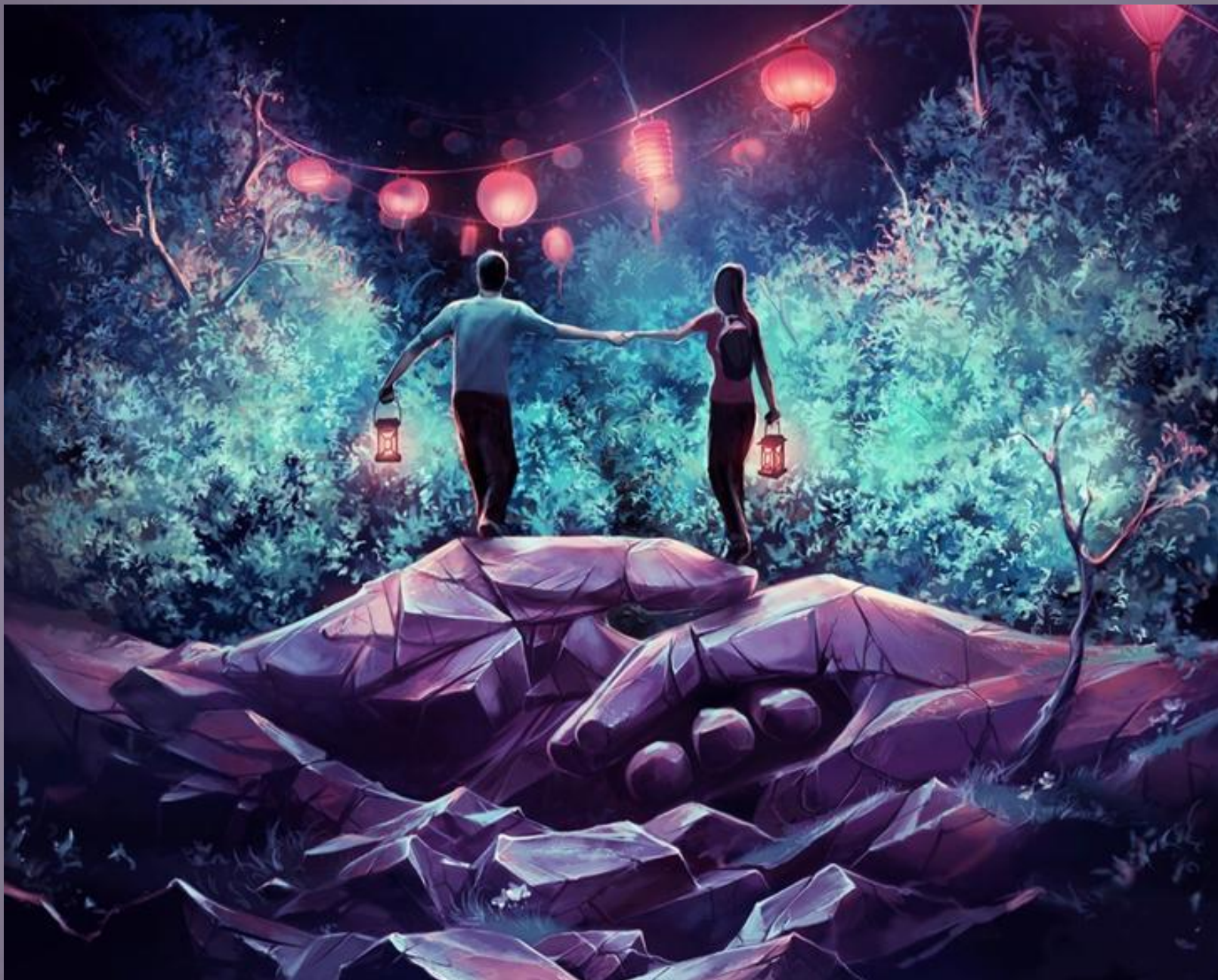
Встреча с неизвестным