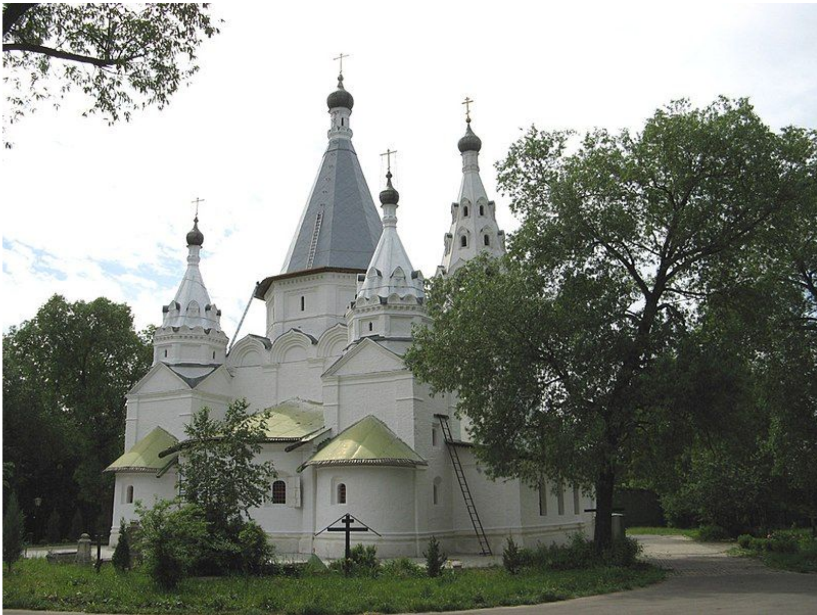
Церковь Живоначальной Троицы в Троицком-Голенищеве на реке Сетунь (1644 - 1645 гг.):