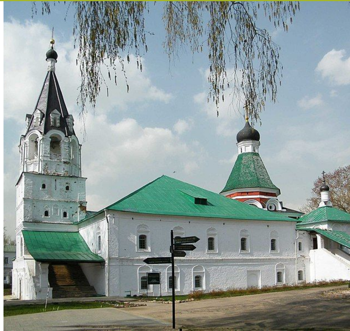
Троицкая (Покровская) церковь Александровской слободы (1510 г.), считающаяся первым каменным шатровым храмом

• Ну и, в-третьих, никто Барму Постника Яковлева не ослеплял (Ивану Грозному приписывают и без того множество зверств, так давайте хотя бы в этом грехе перестанем его обвинять). Прямым доказательством зрячести псковского архитектора является хотя бы то, что после завершения строительства Покровского собора он в течение нескольких лет участвовал в возведении Казанского кремля.