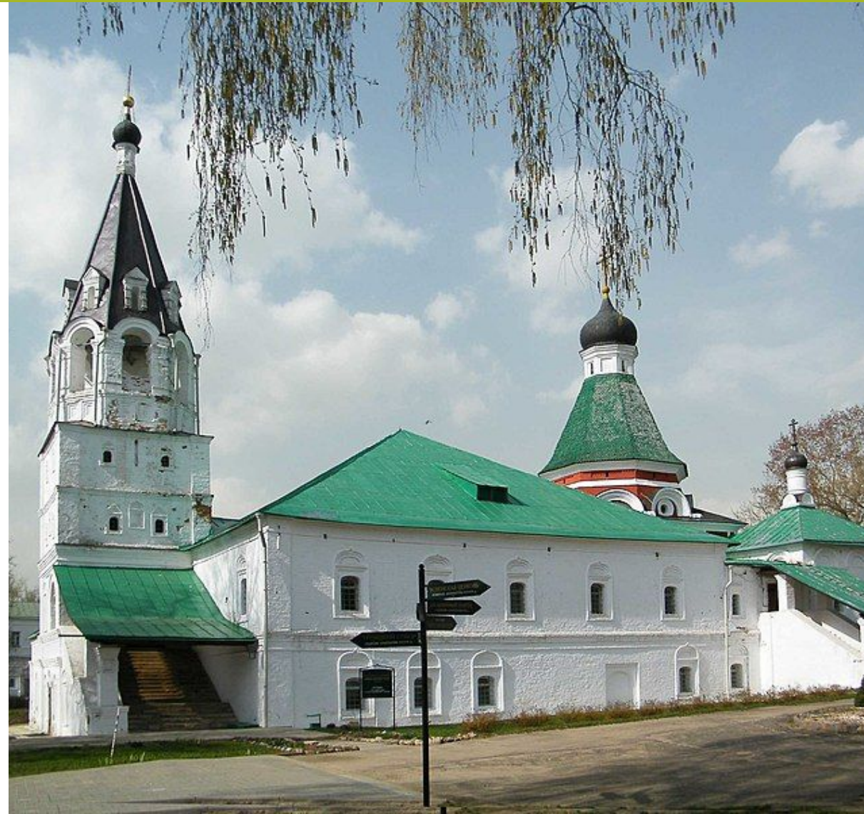
Троицкая (Покровская) церковь Александровской слободы (1510 г.), считающаяся первым каменным шатровым храмом