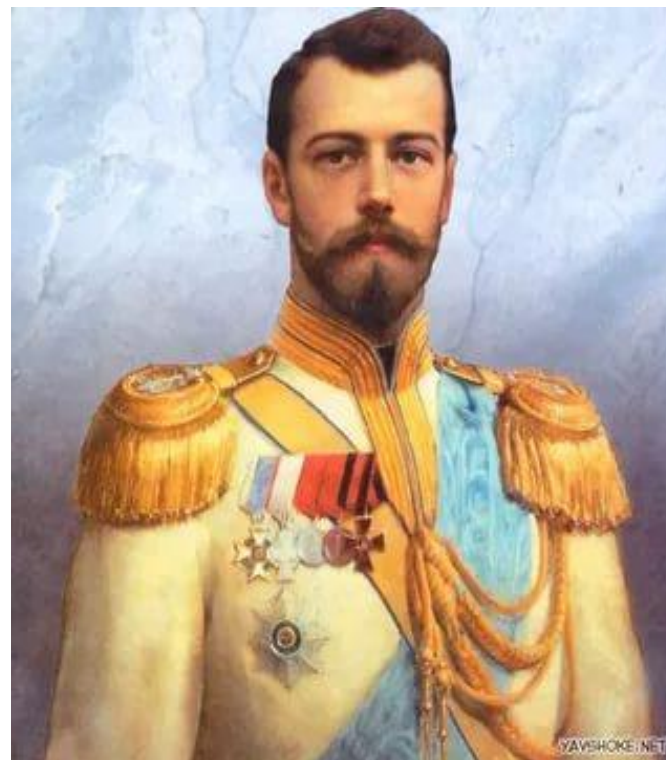
Николай II Российская Империя