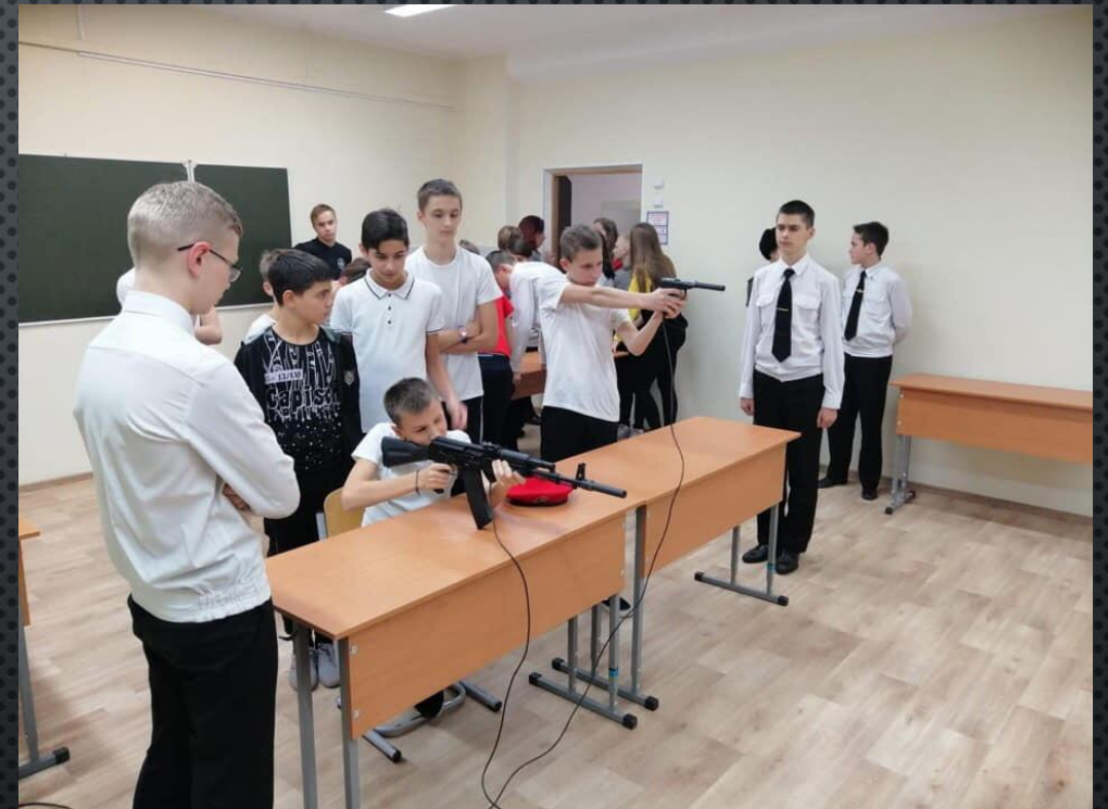
Стрельба в электронном тире