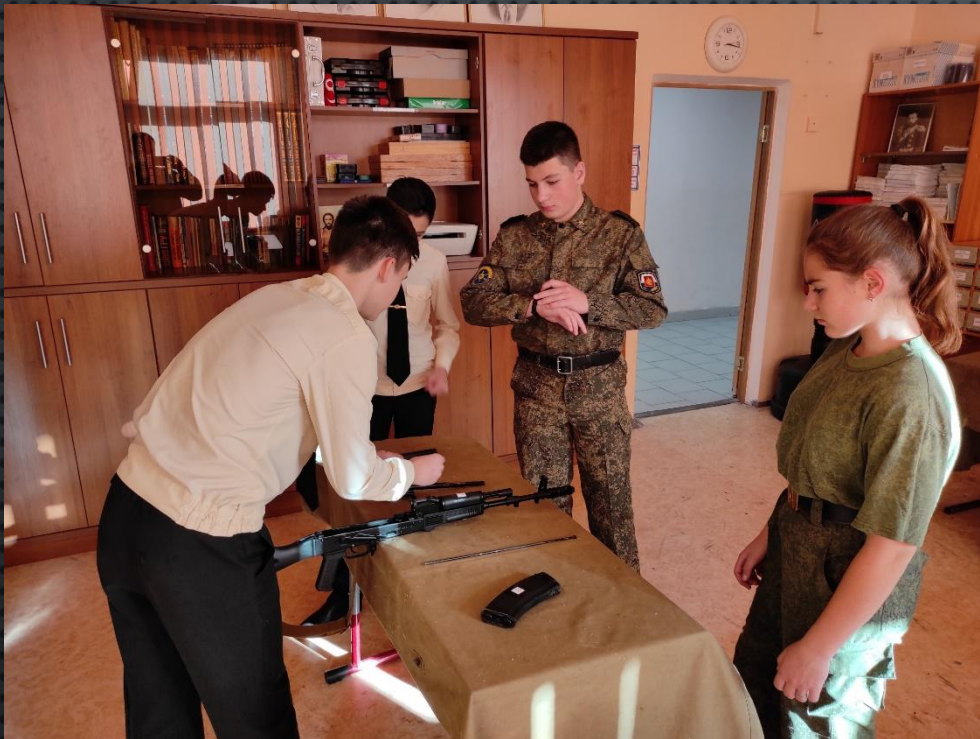
Разборка , сборка АК-74М