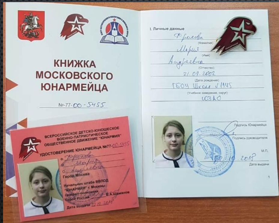
Удостоверение и книжка московского Юнармейца