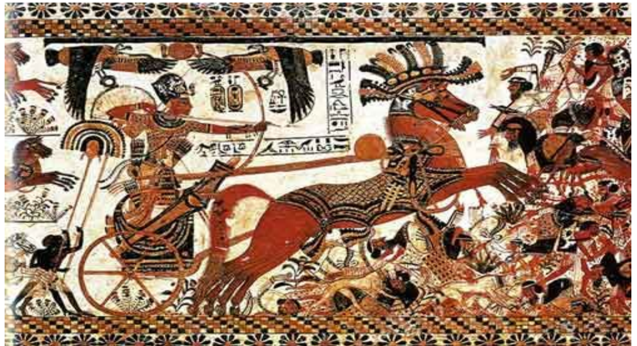
Тутмос III в бою.