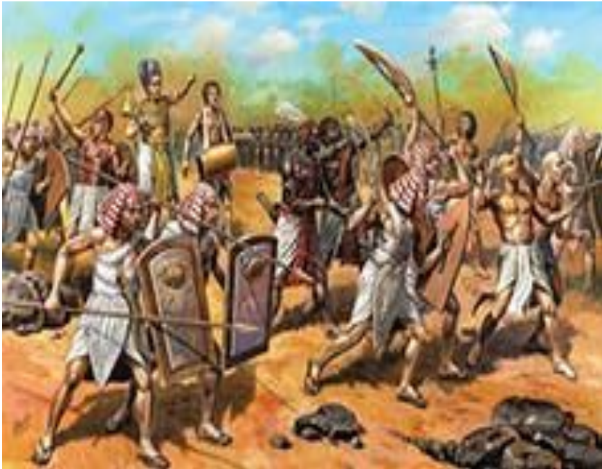
Египетская армия в бою.

Египетская армия состояла из пехоты и боевых колесниц. В пехоте служили крестьяне и ремесленники. Главной силой армии были боевые колесницы. На колесницах воевали богатые и знатные люди — вельможи, а иногда и сам фараон.