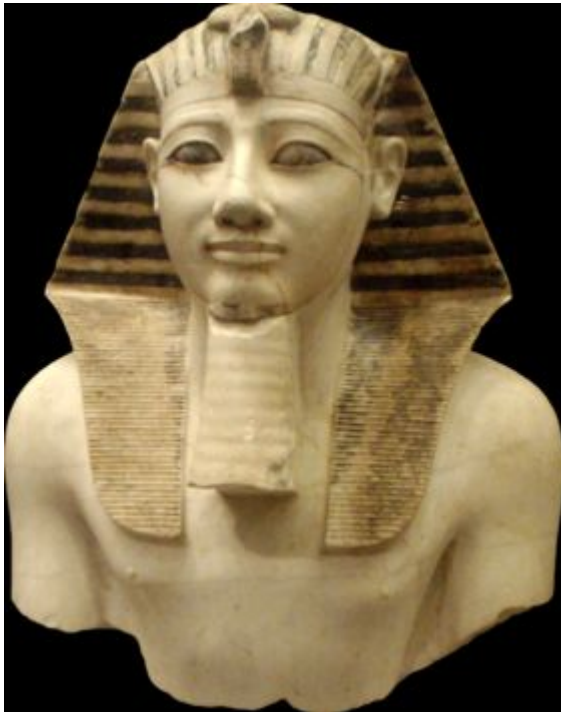
Фараон Тутмос III.

Наиболее часто фараоны делали завоевательные походы в Нубию и Палестину. Самым успешным завоевателем был фараон Тутмос III. Он правил в 1479-1425 годах до нашей эры. Он полностью захватил Нубию и Палестину.