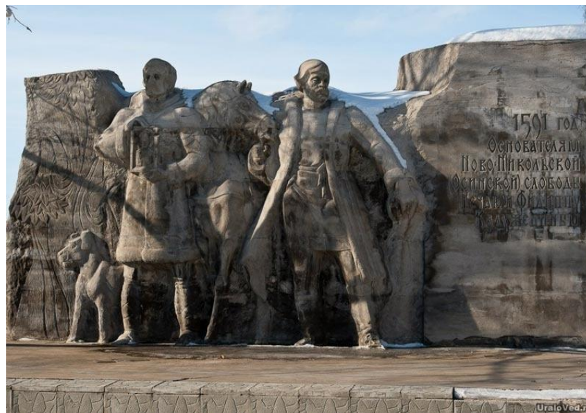
Памятник основателям .

По летописным данным Оса появилась ещё в 1591 г. под названием Ново-Никольской слободы, а основали её братья Нечай и Филипп Калуженины на башкирских землях. Как крепость Оса с 1621 г., в 1737 г. Оса получила статус города и стала центром воеводства.