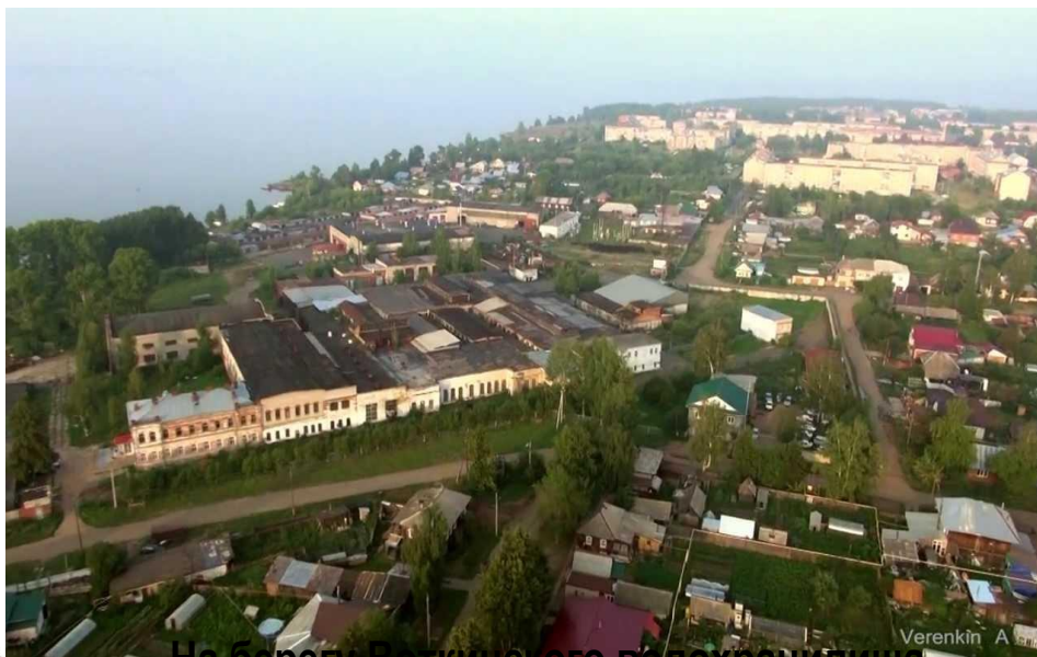
На берегу Воткинского водохранилища на реке Кама.