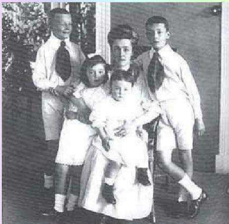
1907 год. Владимир Владимирович Набоков (справа) с матерью Е. И. Набоковой , братом Сергеем, сестрами Еленой и Ольгой.