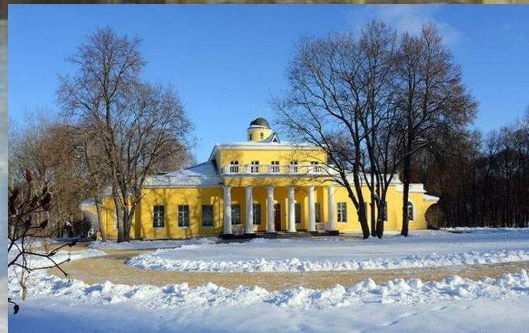
Родовая усадьба Тютчевых в Овстуге