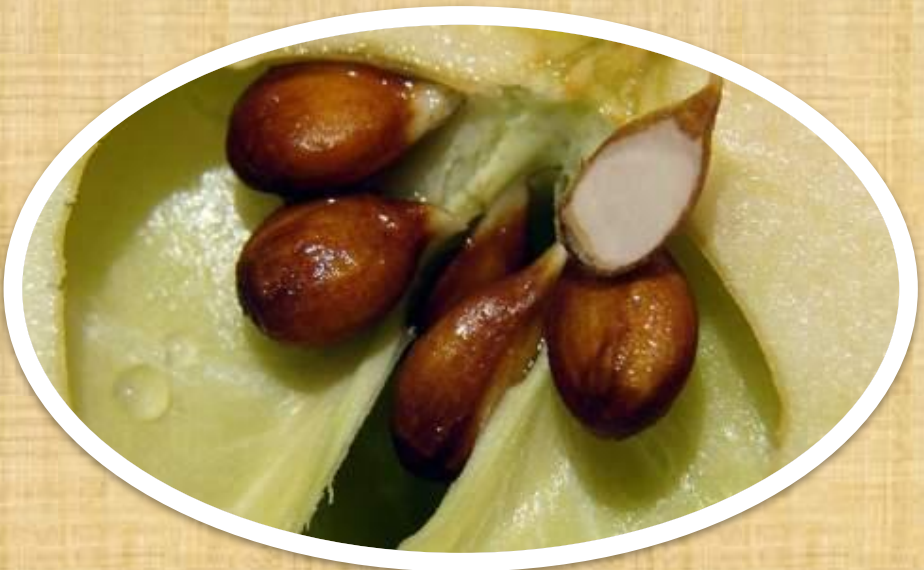
Семена (яблочные косточки)