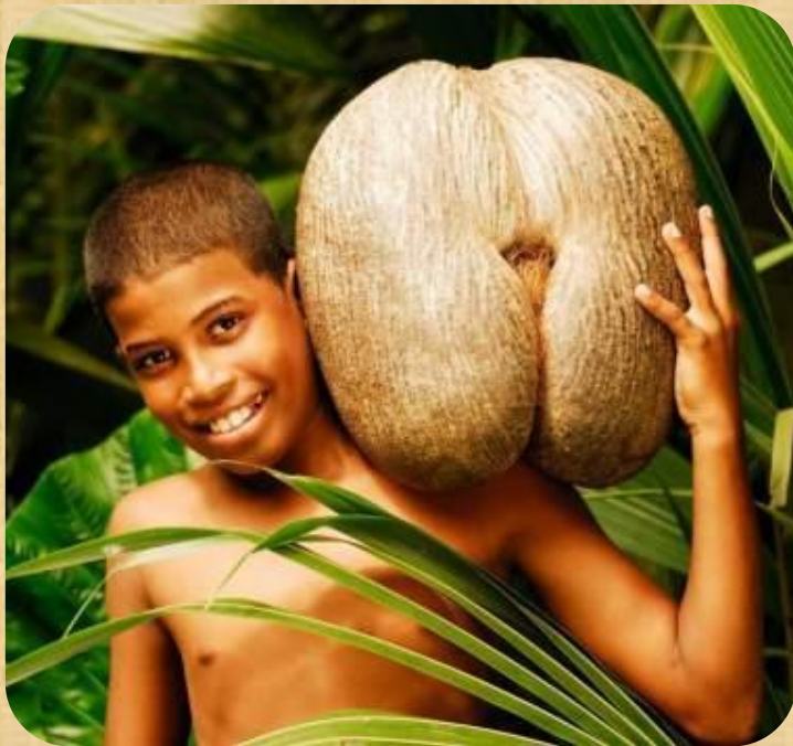
Семя сейшельской пальмы