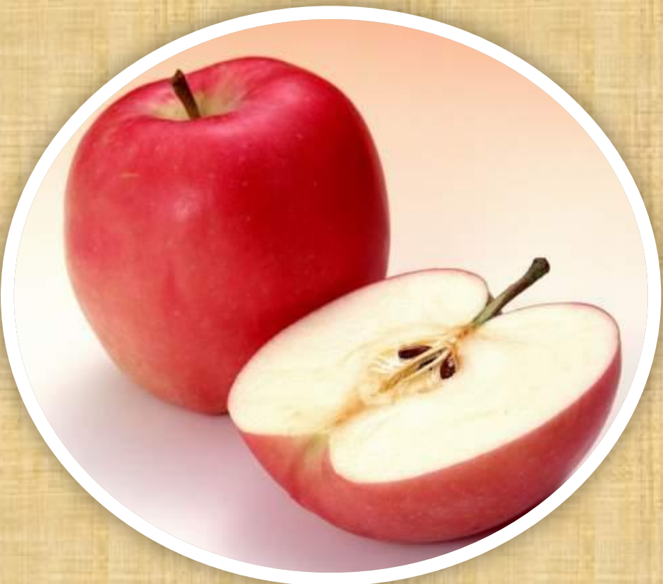
Плод растения (яблоко)