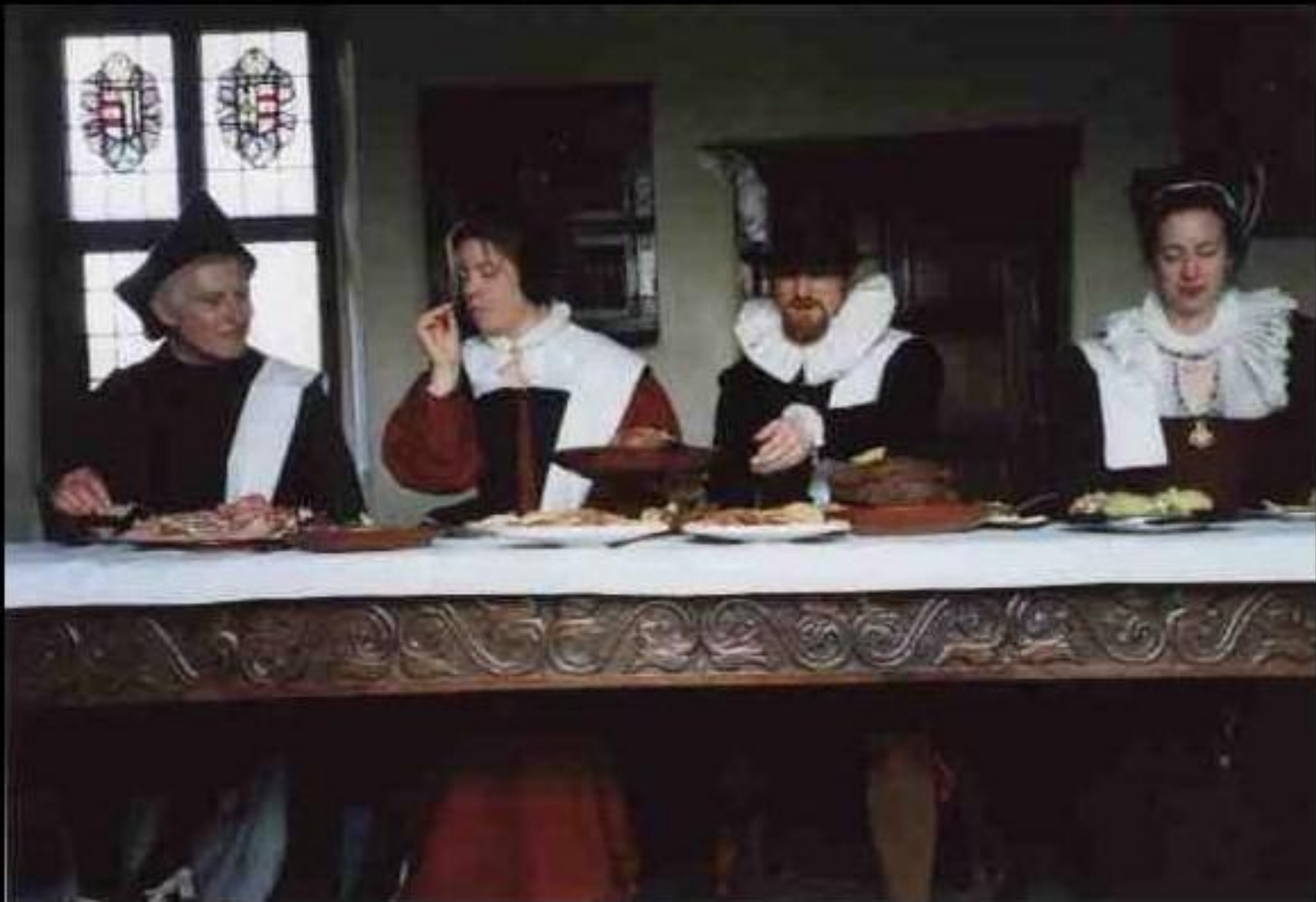
Обед джентри XVI века.