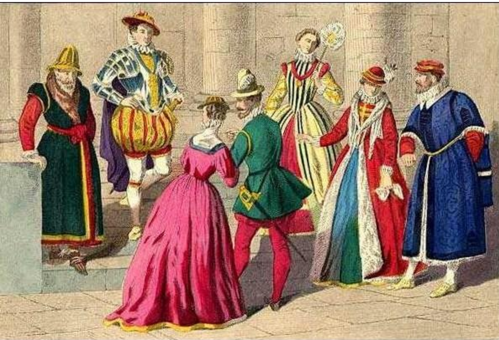
Английская мода второй половины XVI века