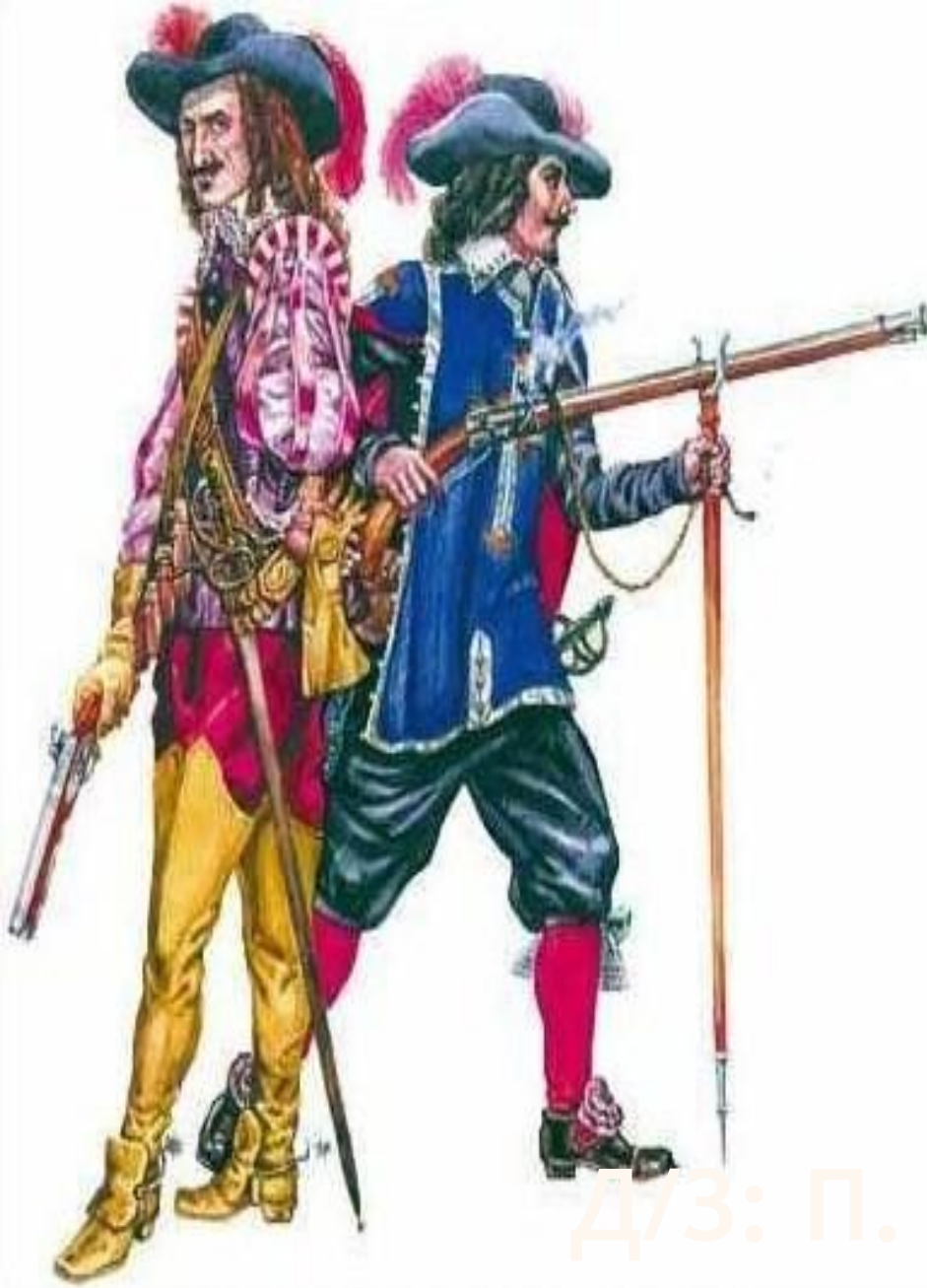
Французские мушкетеры XVII века