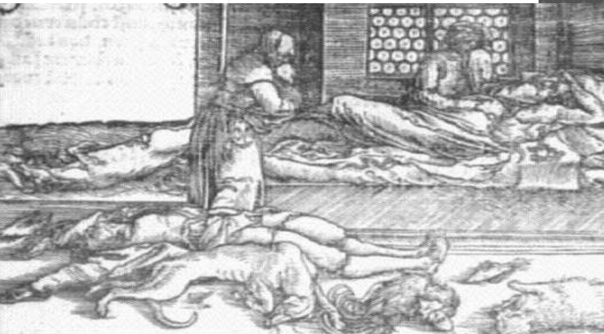
Чума в Европе 1500

«ИЗБАВИ НАС, ГОСПОДИ, ОТ ЧУМЫ, ГОЛОДА И ВОЙНЫ»