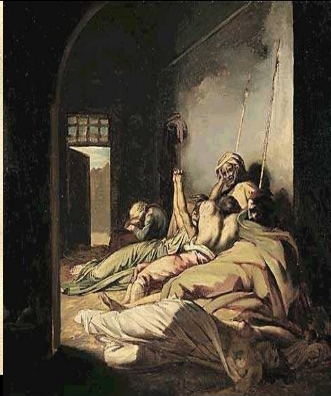
Т. Жерико. Чума