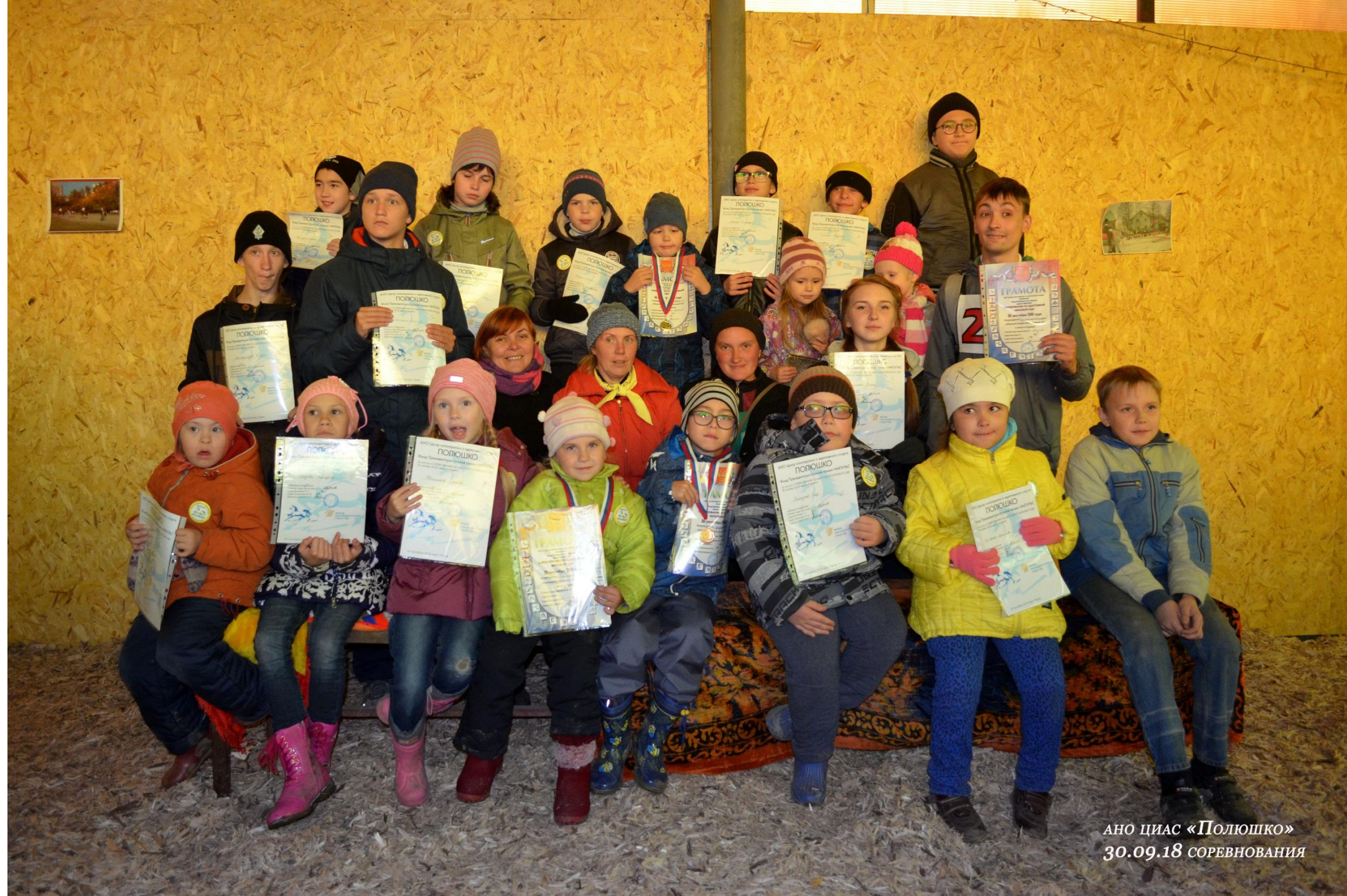
АНО ЦИАС «Полюшко» 30.09.18 СОРЕВНОВАНИЯ