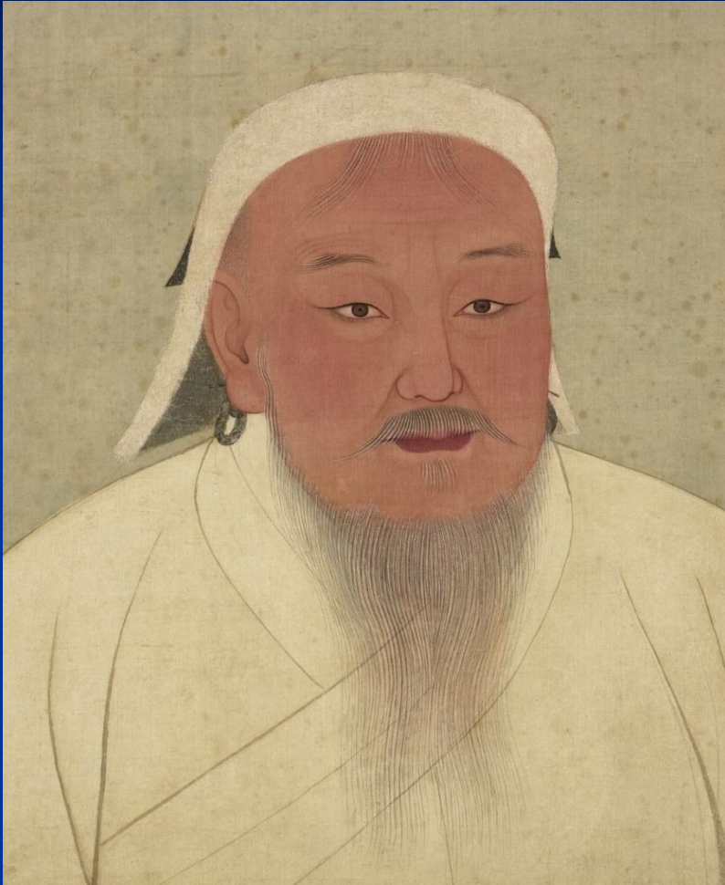
Чингисхан. Китайский рисунок XIII в.

XIII в. – создание Монгольской империи Основатель: Темуджин ( Чингисхан )