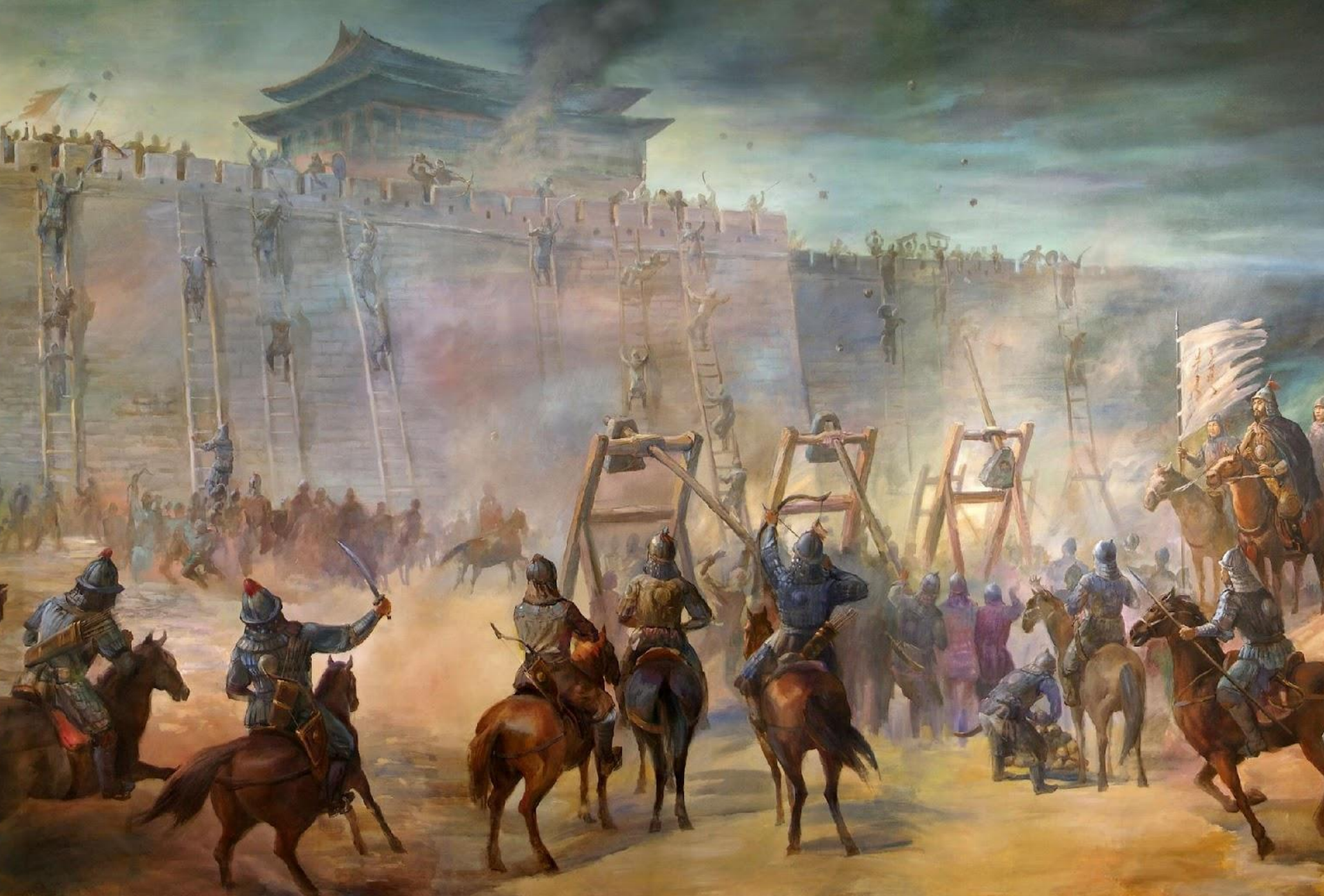
Штурм китайского города монгольскими войсками. Рисунок