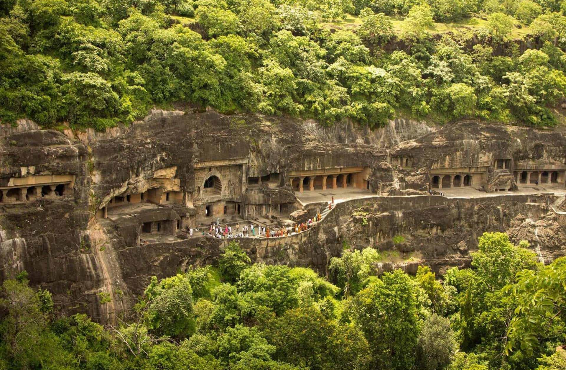
Пещерный храм в Аджанте. Индия. VII в.