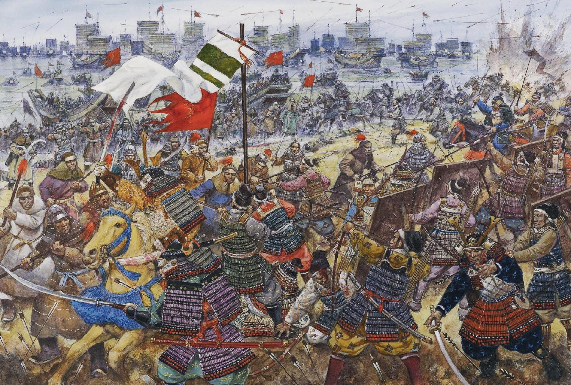
Вторжение монголов в Японию. Рисунок