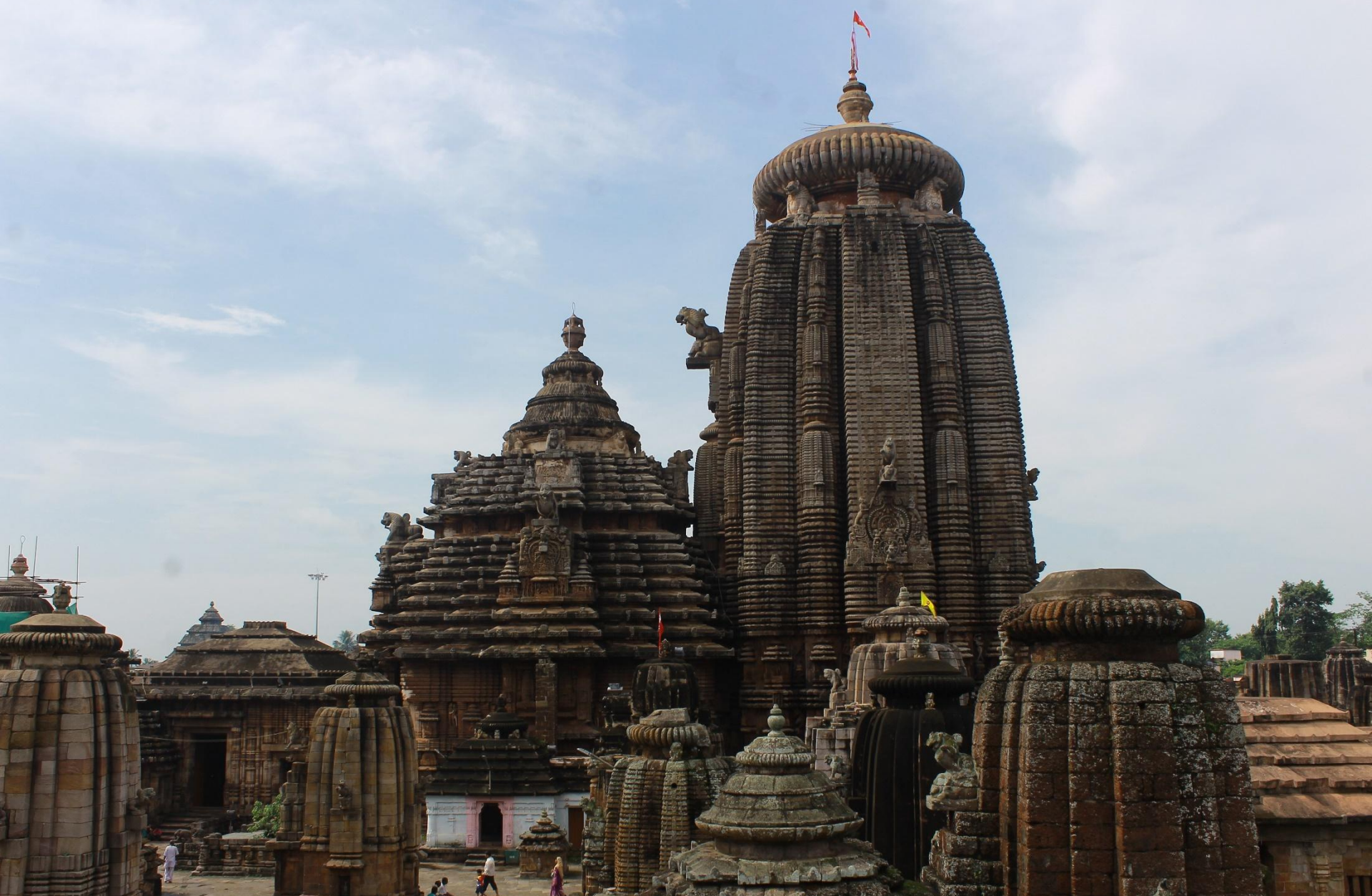
Храм в Одриссе. Индия. XI в.