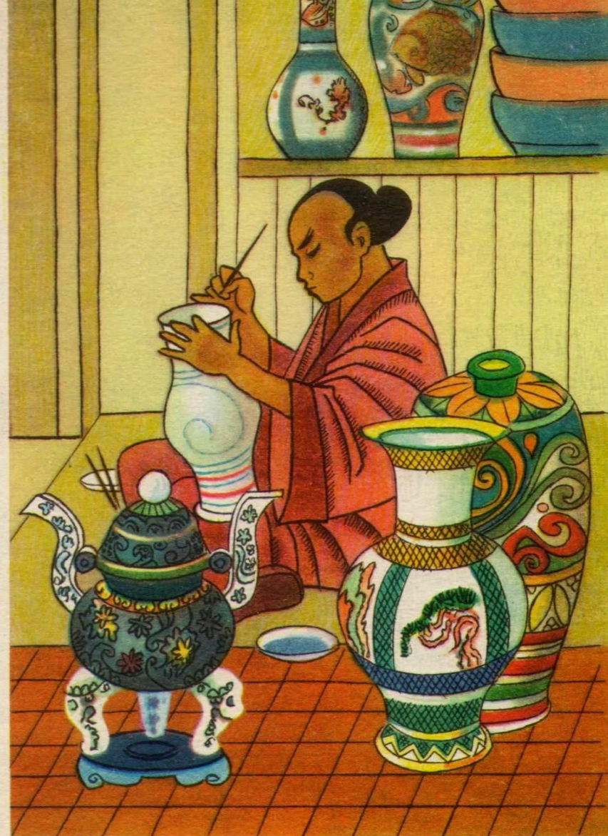
Изготовление фарфора в Китае. Рисунки