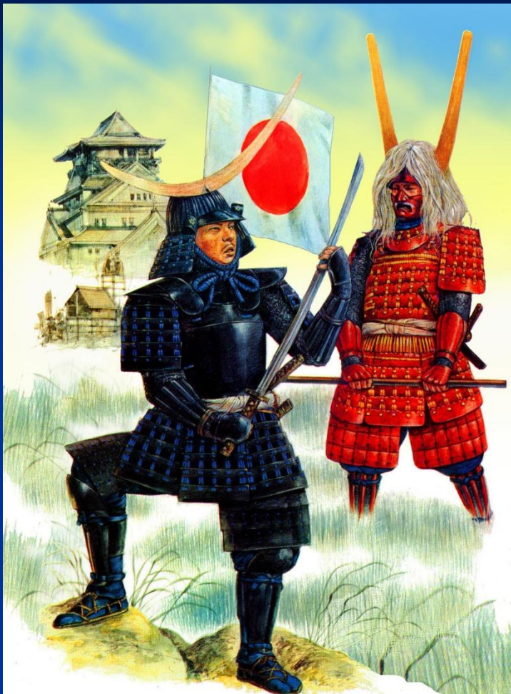
Средневековые самураи. Рисунок