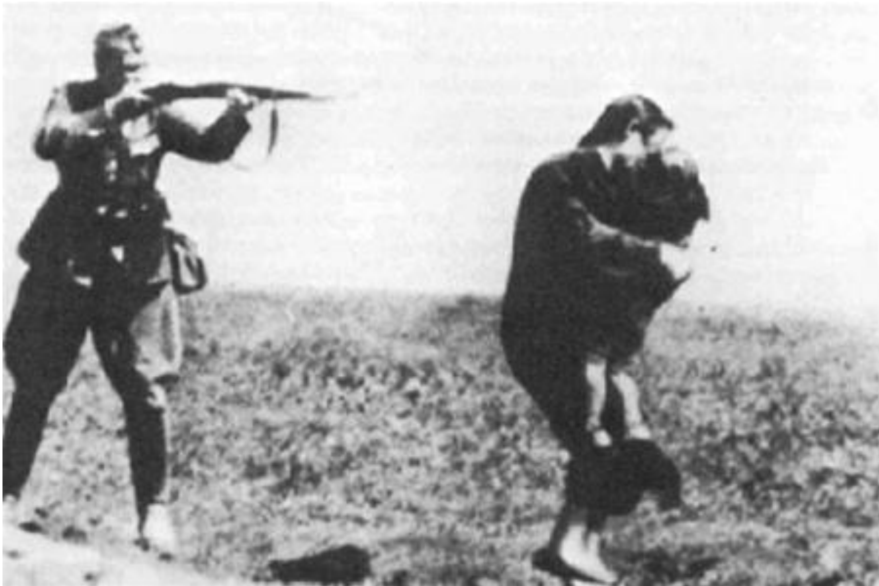
Немецкий солдат расстреливает еврейскую женщину. Фотография, предположительно, сделана в Житомире.