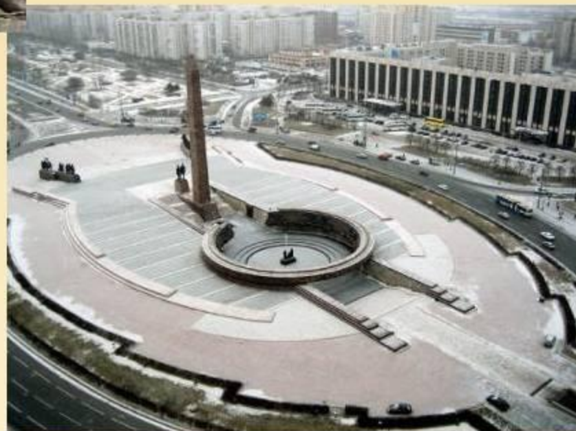
Общий вид мемориала на площади Победы