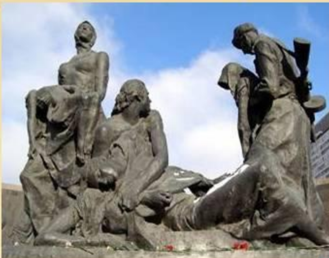
Скульптурная композиция "Блокада"