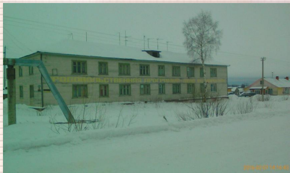
Дом № 8 ул. 70 лет Октября (1988 г. -1997 г.)