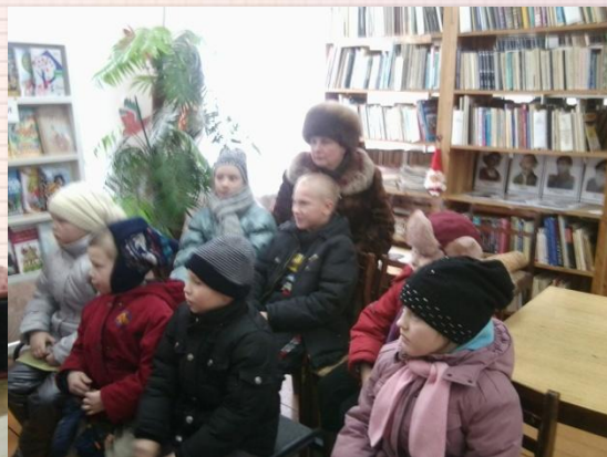
ГБСУ АО «УСРЦН» Ростовская основная школа