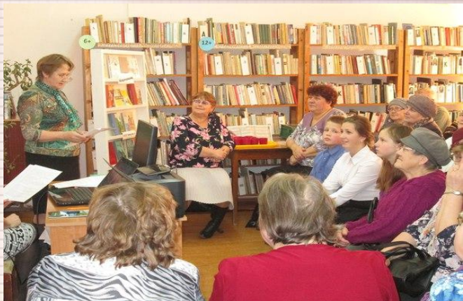
Совет ветеранов и члены ВОИ