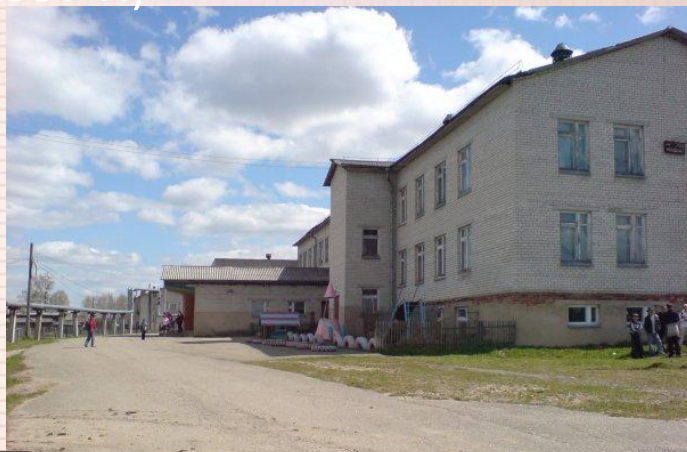
Ростовская школа с 2007 года г.