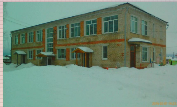
Д/сад «Солнышко» (1997 г. – 2007 г.)