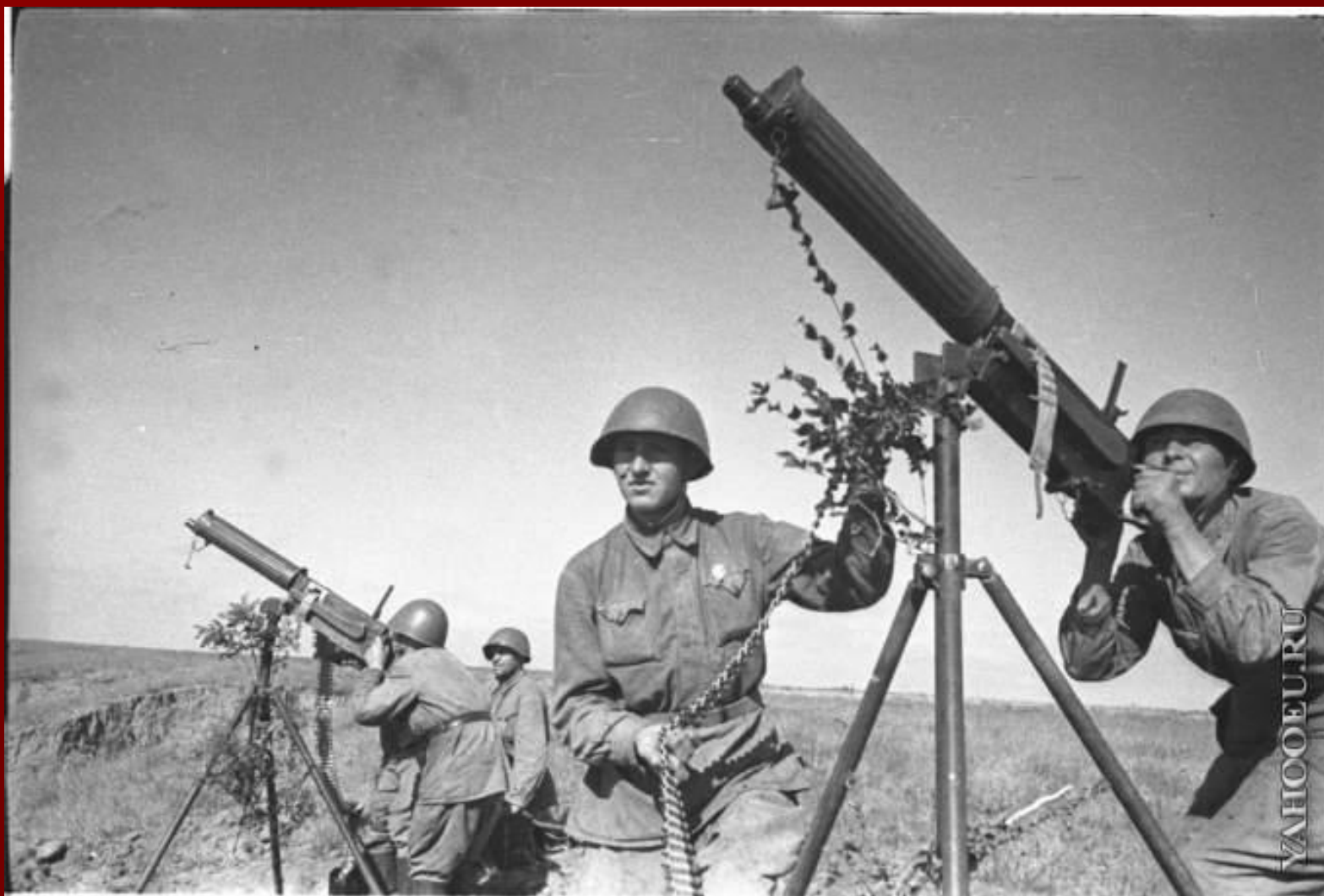
Зенитная пулемётная рота