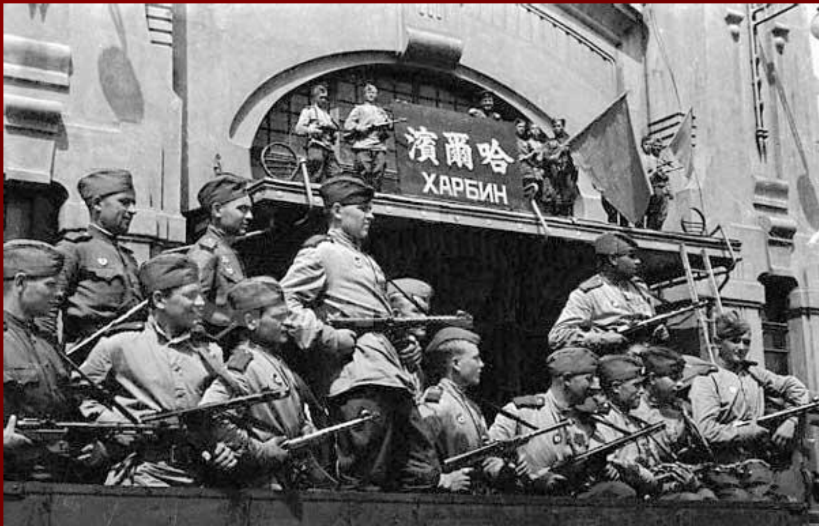
Война с Японией 1945 год