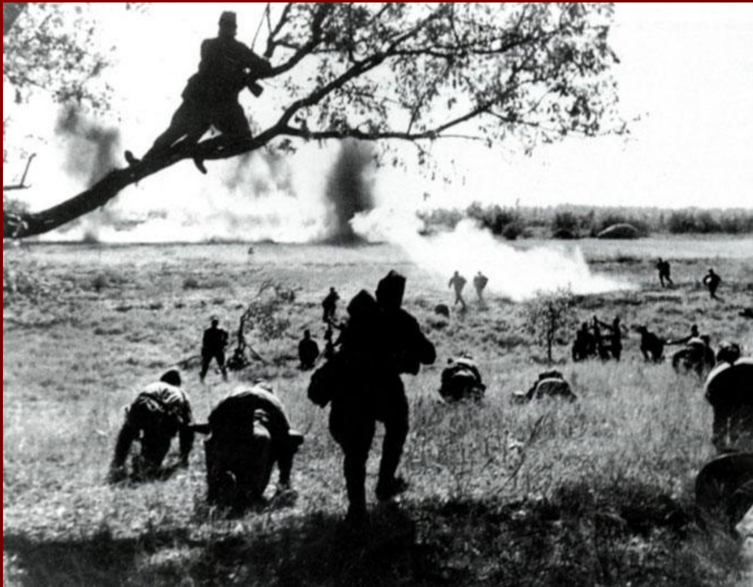
Битва на Орловско-курской дуге