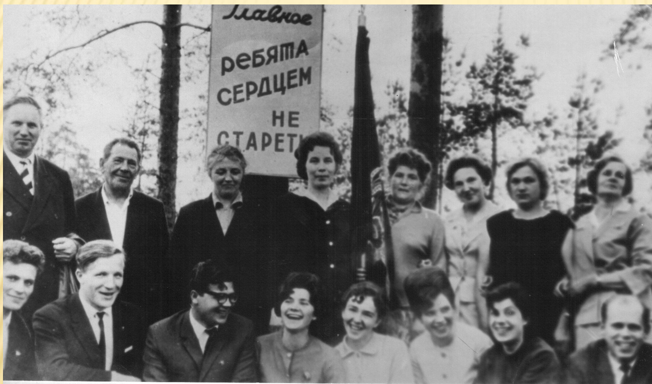
Встреча с работниками торфопредприятия 20 лет спустя.