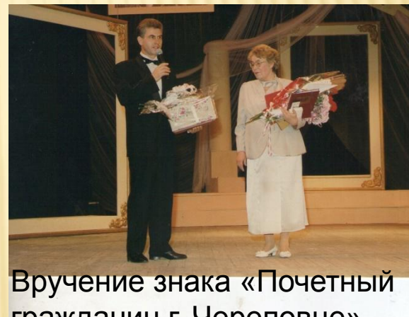
Вручение знака «Почетный гражданин г. Череповце»

22 / ГОЛОС 6 марта 2012 г. / череповчане