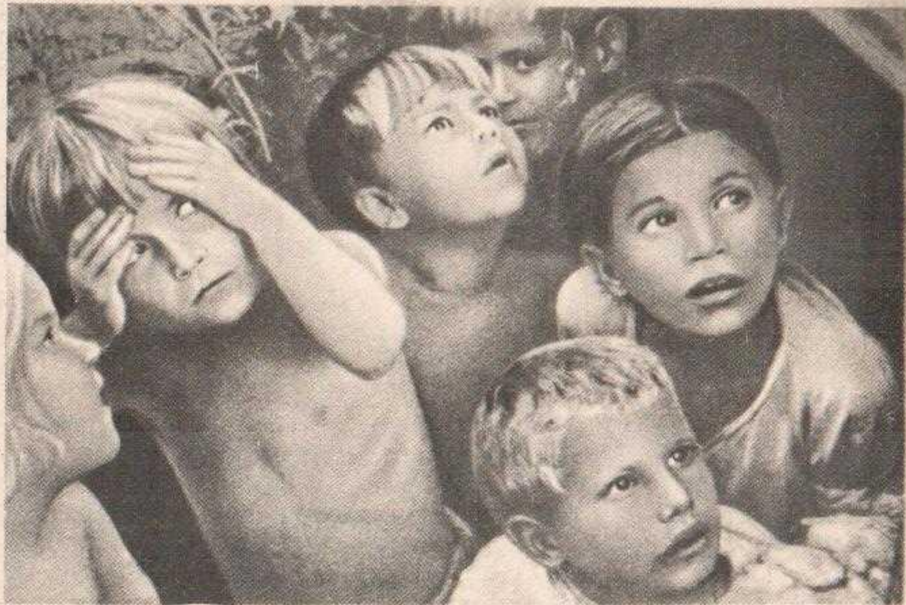
Советские дети, укрывшиеся от фашистской авиации.