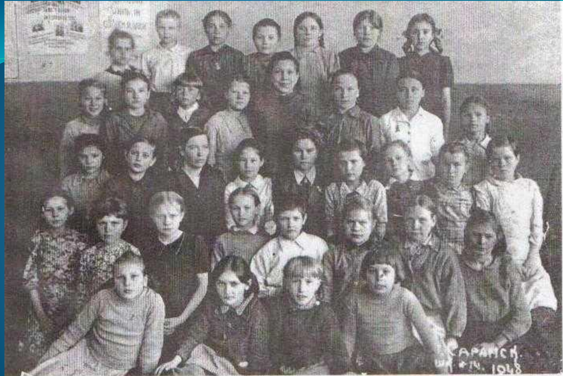
Учащиеся Саранской женской школы № 14