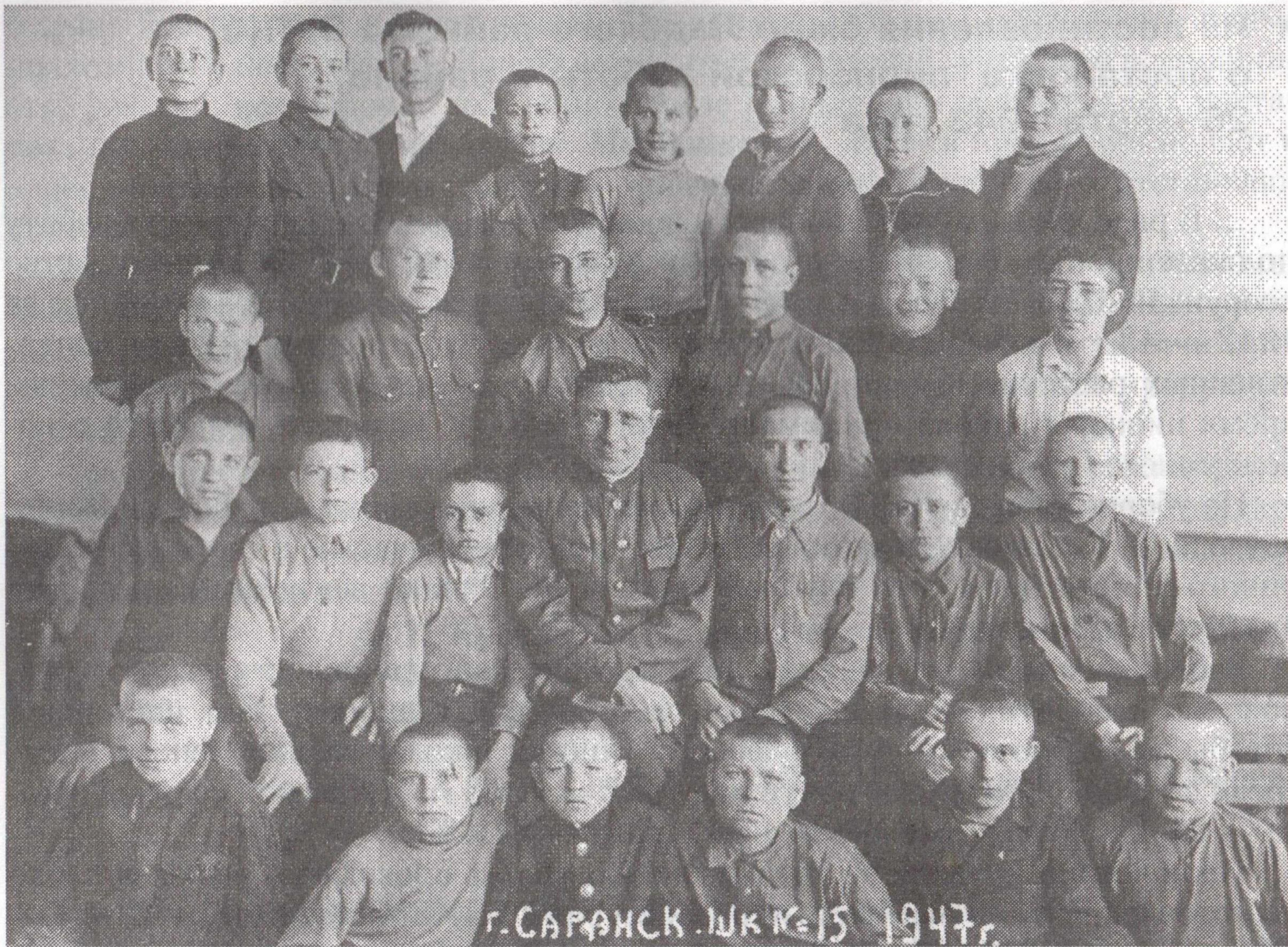
Дети войны. Учащиеся Саранской школы № 15