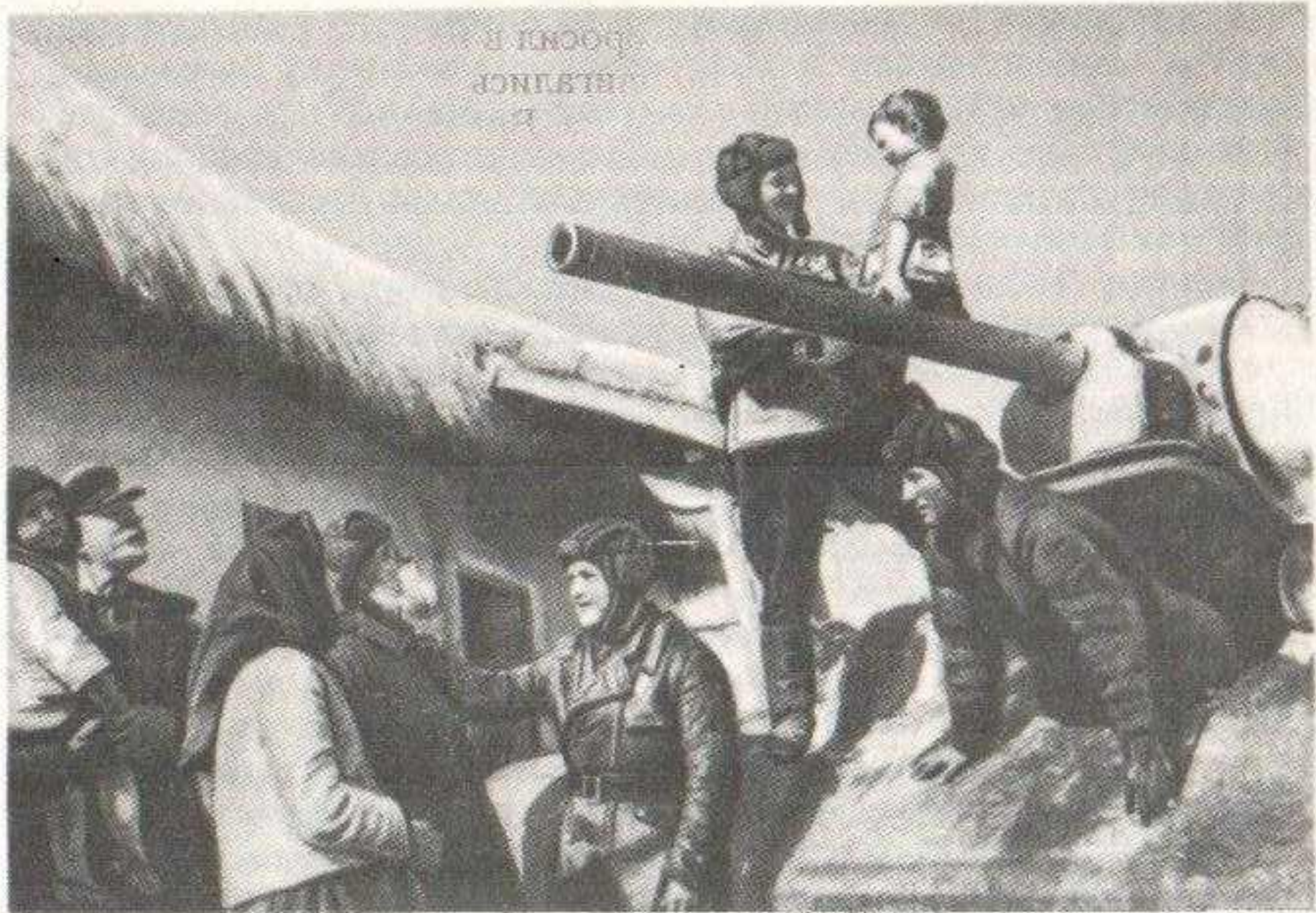
Советские танкисты в освобожденной деревне. Воронежский фронт, 1943 г.