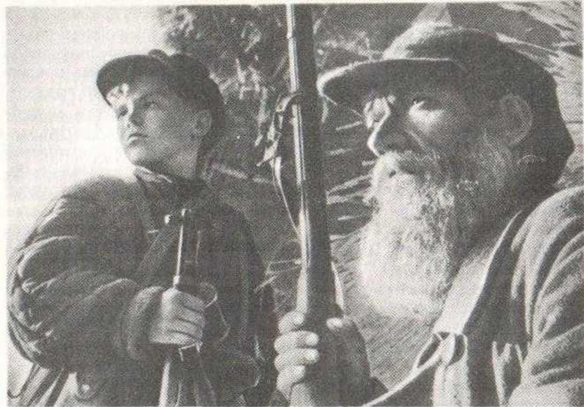
Партизанский дозор. Ленинградская область, 1943 г.