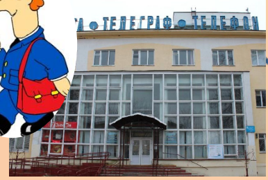
Центральное отделение почтовой связи

Центральное отделение почтовой связи существует почти с основания города. Через него проходят основные потоки почтовых отправлений