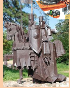
Скульптурная композиция «Странствующий король»