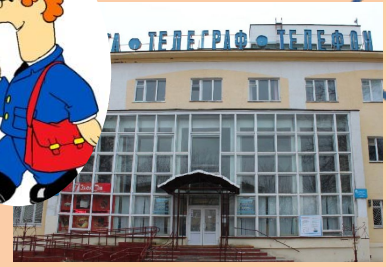
Центральное отделение почтовой связи

Центральное отделение почтовой связи существует почти с основания города. Через него проходят основные потоки почтовых отправлений