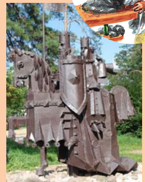
Скульптурная композиция «Странствующий король»