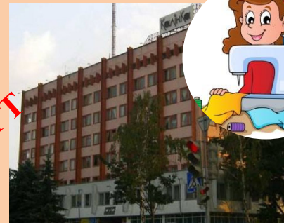
Швейная фабрика «Калинка»

Предприятие создано на базе швейной фабрики, в ноябре 1981 года. В настоящее время на предприятии работает 800 человек и предприятие выпускает разнообразный ассортимент для взрослых и детей, начиная с легкого ассортимента и заканчивая утепленными куртками, пальто и полупальто.