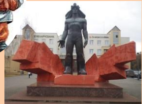
Памятник в честь шахтёров-первопроходцев

Памятник в честь шахтёров-первопроходцев установлен 28 августа 1977 года. Задумку архитекторов монумента воплотил в жизнь скульптор Г. В. Буралкин. Памятник выполнен из бетона, скульптура шахтёра облицована медью. Общая высота монумента – 6 метров.