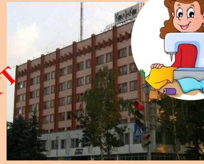
Швейная фабрика «Калинка»

Предприятие создано на базе швейной фабрики, в ноябре 1981 года. В настоящее время на предприятии работает 800 человек и предприятие выпускает разнообразный ассортимент для взрослых и детей, начиная с легкого ассортимента и заканчивая утепленными куртками, пальто и полупальто.