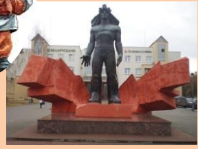
Памятник в честь шахтёров-первопроходцев