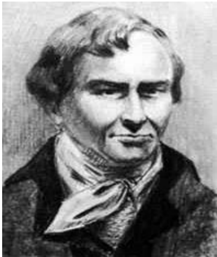
Никола Леблан 1791 г.