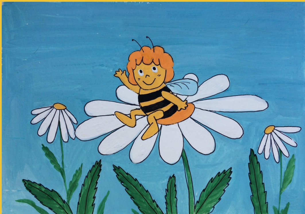
Рисунок с пчёлкой Майей готов!

Возьмите твёрдый маркер и тонкими линиями обведите все объекты рисунка. Не забудьте про усики!