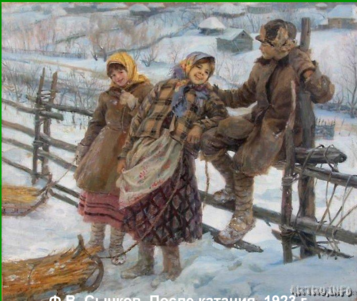
Ф.В. Сычков. После катания. 1923 г.