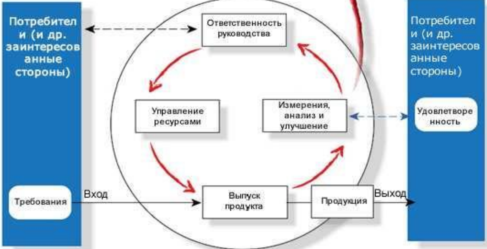
РИС.1 МОДЕЛЬ ПРОЦЕССНОГО ПОДХОДА УПРАВЛЕНИЯ