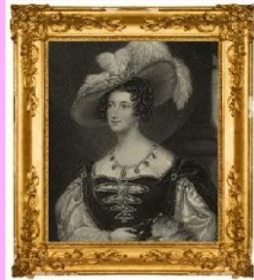
The 7th Duchess of Bedford.