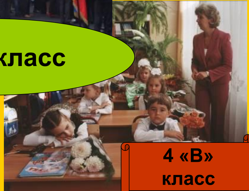
4 «В» класс