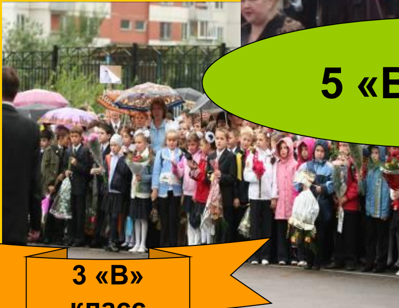
3 «В» класс