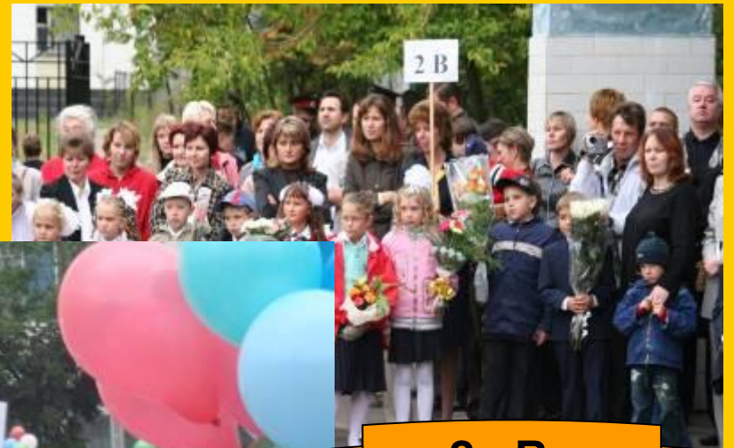
2 «В» класс