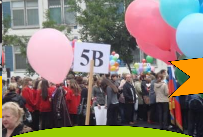
5 «В» класс