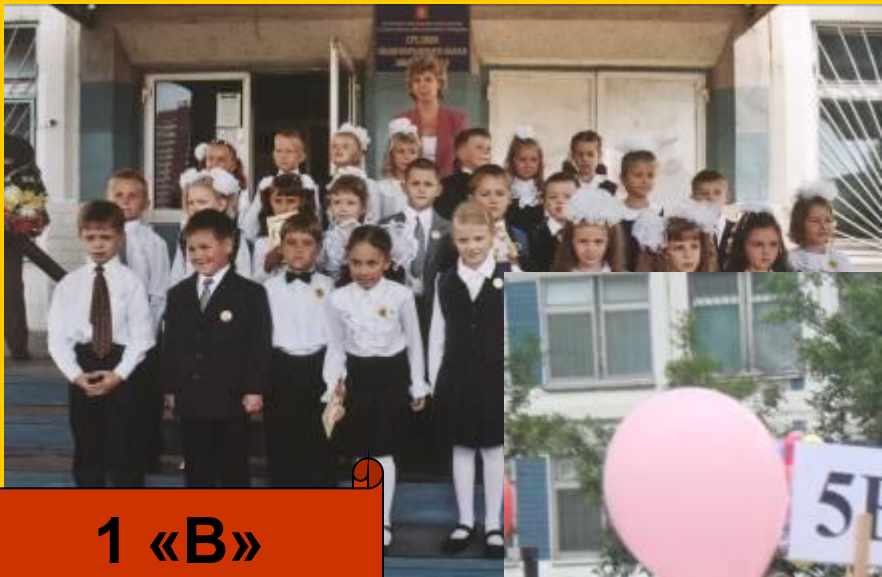
1 «В» класс