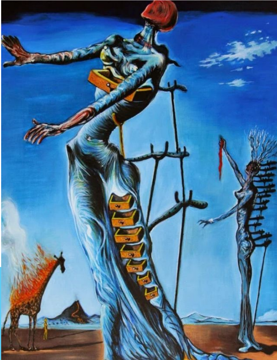
«жираф в огне» Сальвадор Дали.

Еще одна картина из целого ряда полотен, в которых Дали передал собственное переживание и ощущение войны. Картина, как и все другие творения автора, содержит мистически-фантастические образы, которые поражают воображение своей абсурдностью. Но если выключить рациональное мышление и опереться исключительно на эмоциональное восприятие, тогда все смыслы становятся понятны. Две женские фигуры (любимый образ Дали) — это воплощение человеческого сознания. Оно не стойкое, шатающееся, ему постоянно нужна поддержка и опора. Выдвижные ящики — это память и мысли, которые люди стремятся спрятать, но в какой-то момент