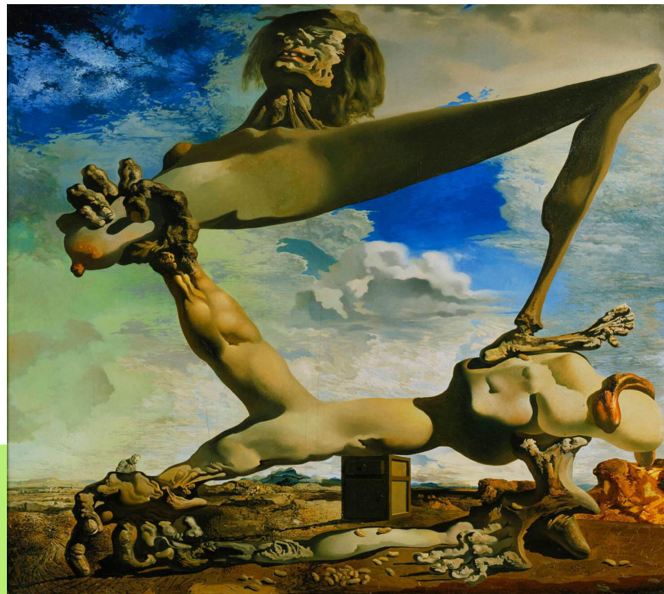
«Предчувствие гражданской войны»