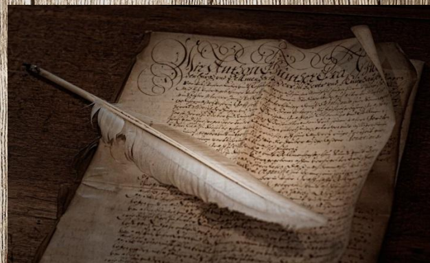
1 письмо из района Красное.