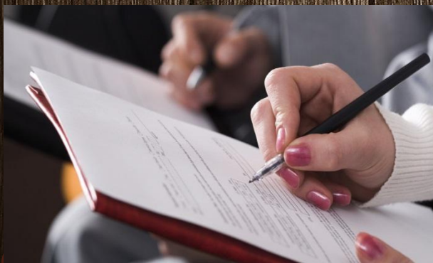
Справка о подлинности Взятия земли.