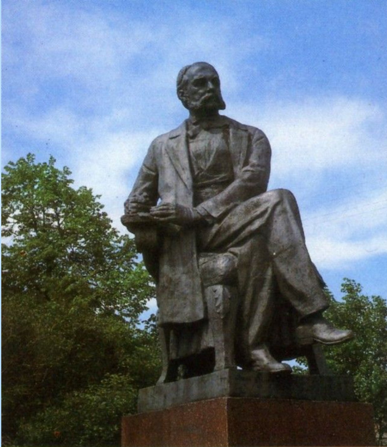
Памятник Ивану Гончарову в Ульяновске