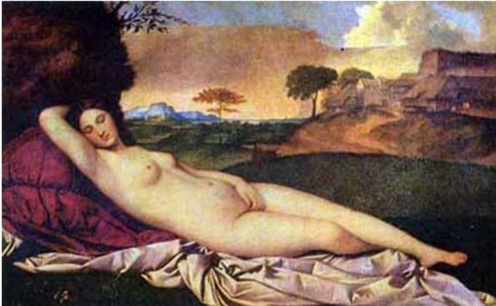
Спящая Венера. 1507 – 1508.