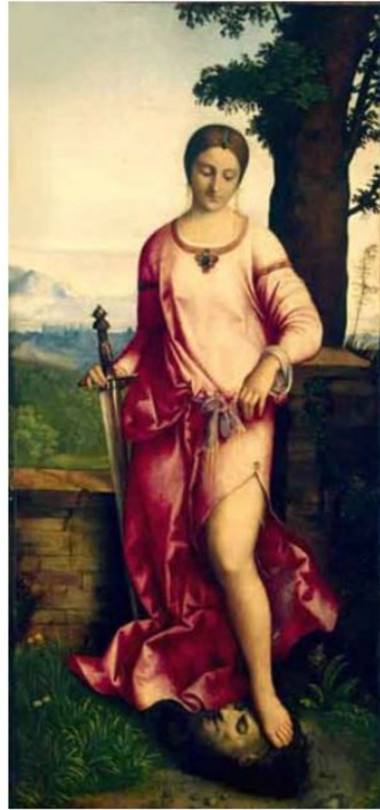
«Юдифь» (около 1502 г.)

Посвящена подвигу библейской героини Юдифи, спасшей родной город от нашествия ассирийцев. Она отправилась в стан врагов и убила Их полководца – Олоферна. Войско неприятеля отступило. Прекрасная Юдифь олицетворяет в картине высшую справедливость.