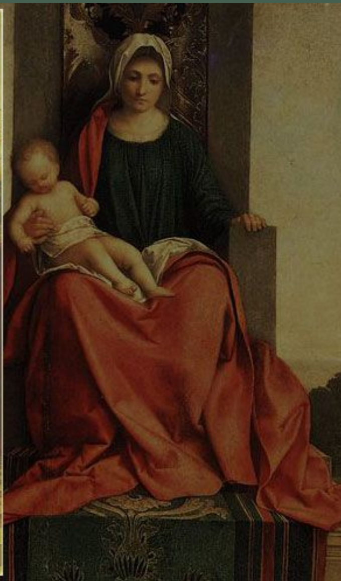
«МАДОННА ДА КАСТЕЛЬФРАНКО», ИЛИ «МАДОННА С МЛАДЕНЦЕМ, СВ. ФРАНЦИСКОМ И СВ. ЛИБЕРАЛЕ»