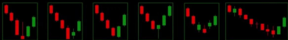
Перевернутый молот «Бычья харами» «Бычье» поглощение Молот «Трехзвездный низ» 8-10 новых низов