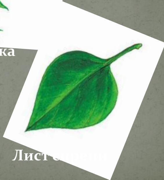
Лист с цельной каймой