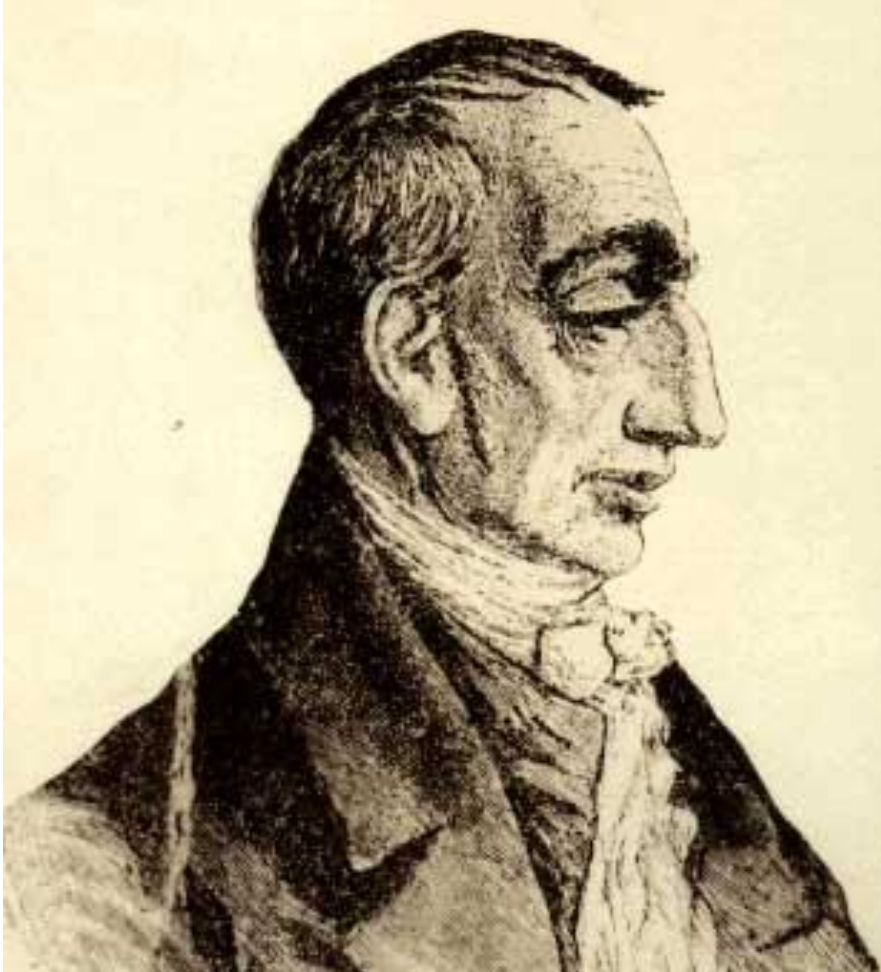
Клод Анри де Рувруа Сен-Симон