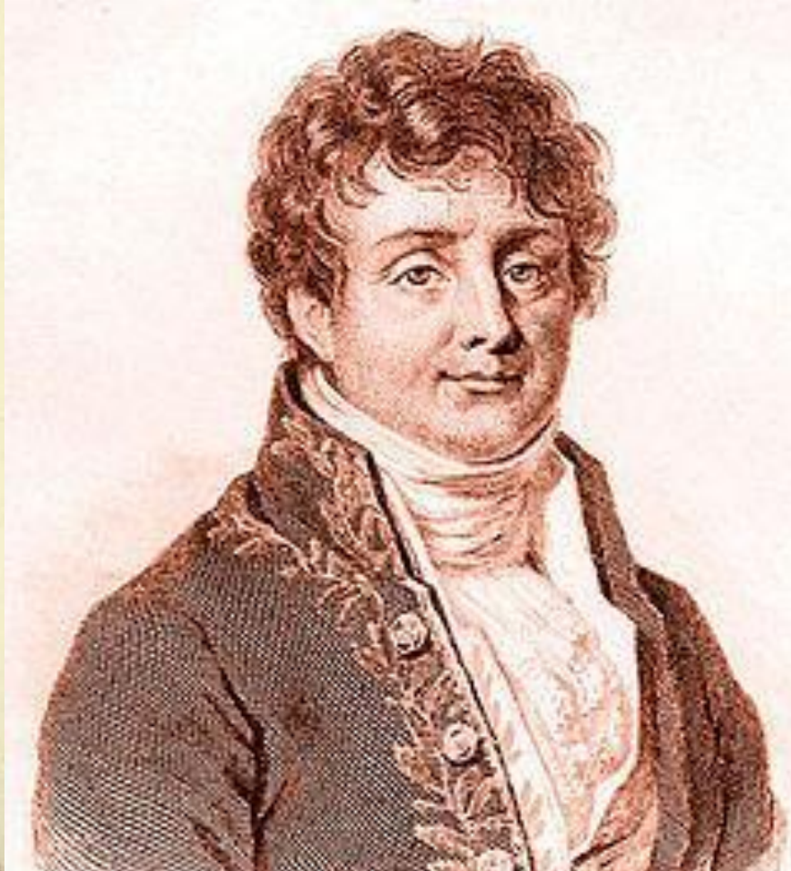
Жан Батист Жозеф Фурье