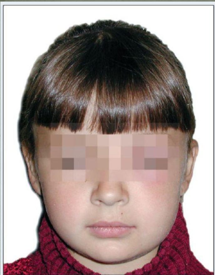
Ребенок 6 лет. Обострение хронического периодонтита зуба 64, острый серозный периостит верхней челюсти слева