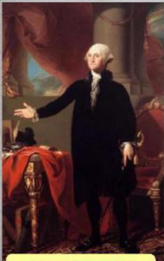
Джордж Вашингтон 1-й президент США

Устанавливался республиканский строй и федеративное устройство