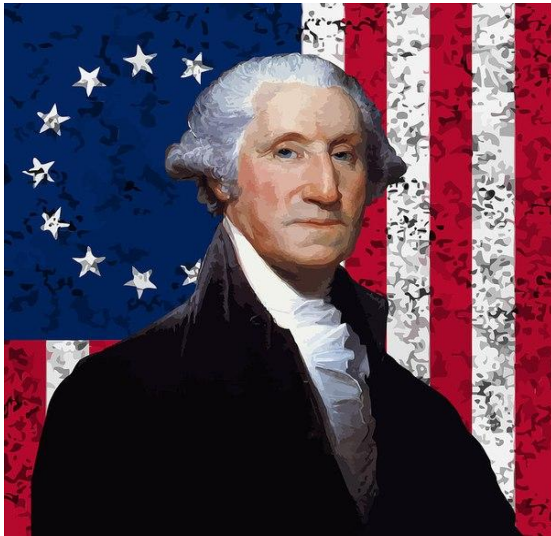
Джордж Вашингтон – главнокомандующий армии колонистов