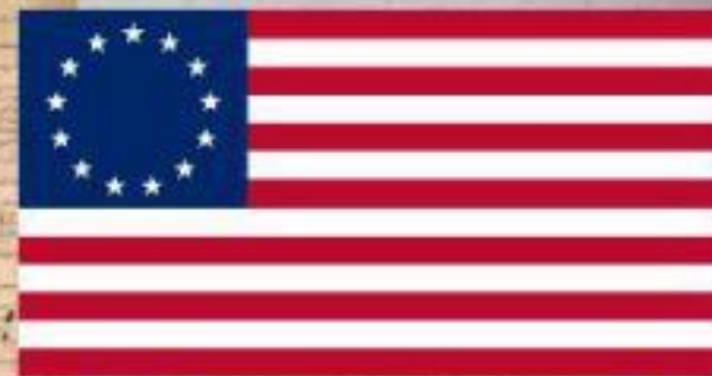
первый флаг США (13 штатов)