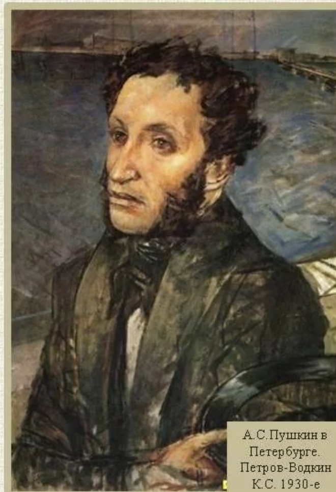
А.С.Пушкин в Петербурге. Петров-Водкин К.С. 1930-е

Цели нет передо мною: Сердце пусто, празден ум, И томит меня тоскою Однозвучный жизни шум.