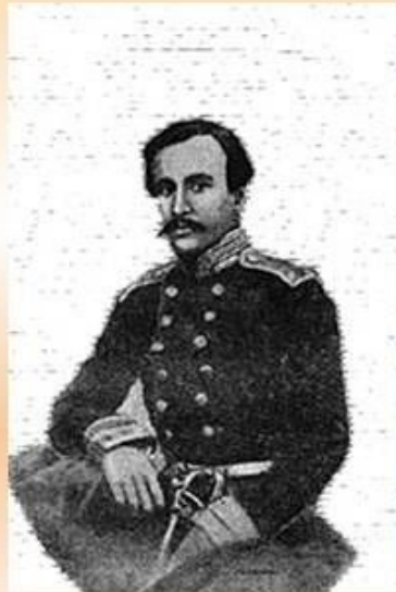
Старший сын Александр Александрович Пушкин (1833-1914г.)