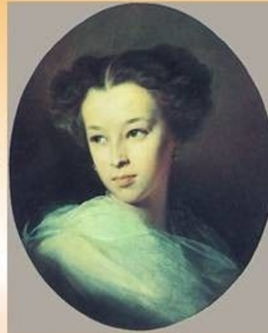
Младшая дочь Наталья Александровна Пушкин (1836-1913г.)