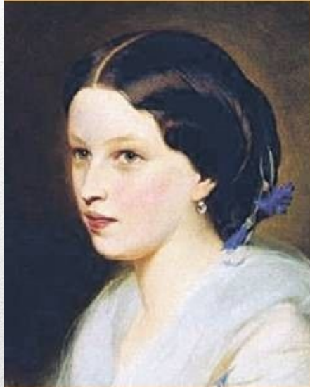
Старшая дочь Мария Александровна Пушкина (1832-1919г.)