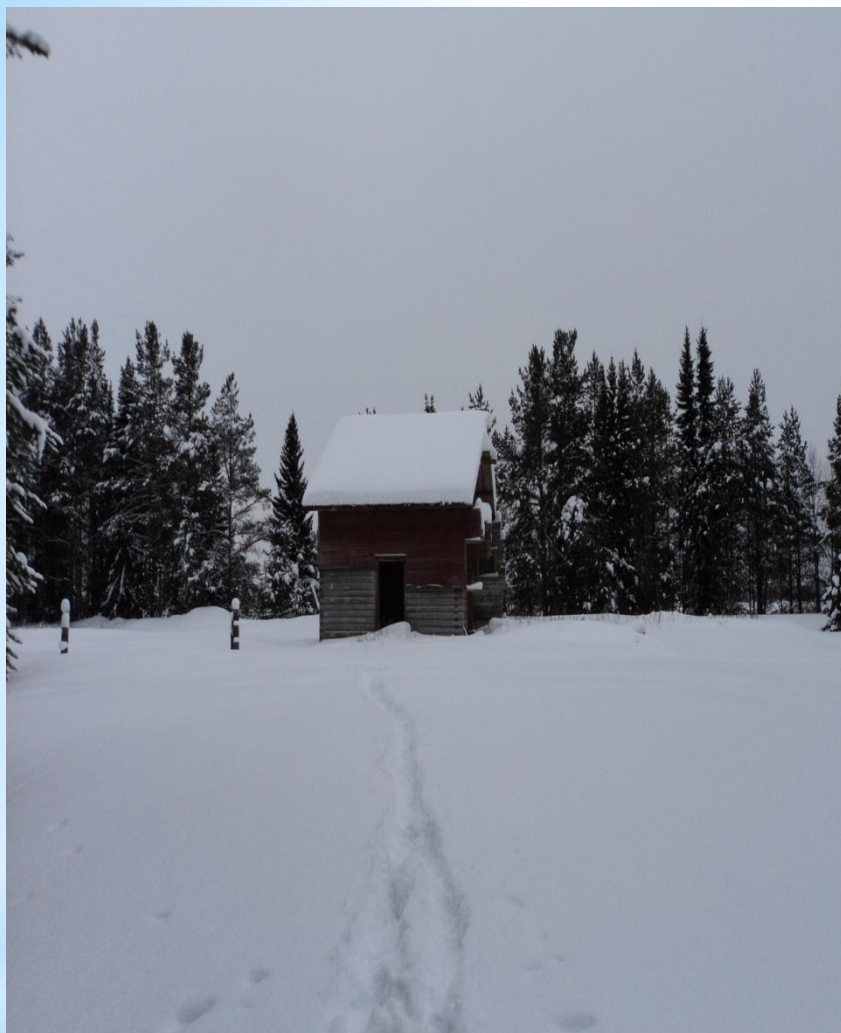
Ветучасток в разобранном виде.