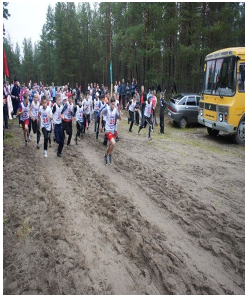
Традиционное районное спортивное соревнование на приз А.А. Ануфриева.2011 год.