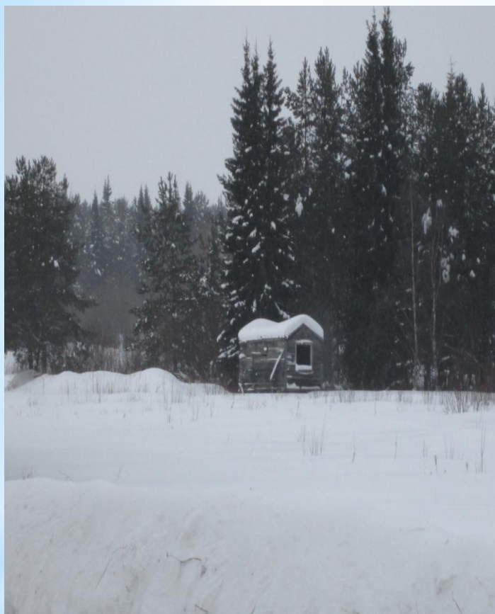
Балок, где жили рабочие.