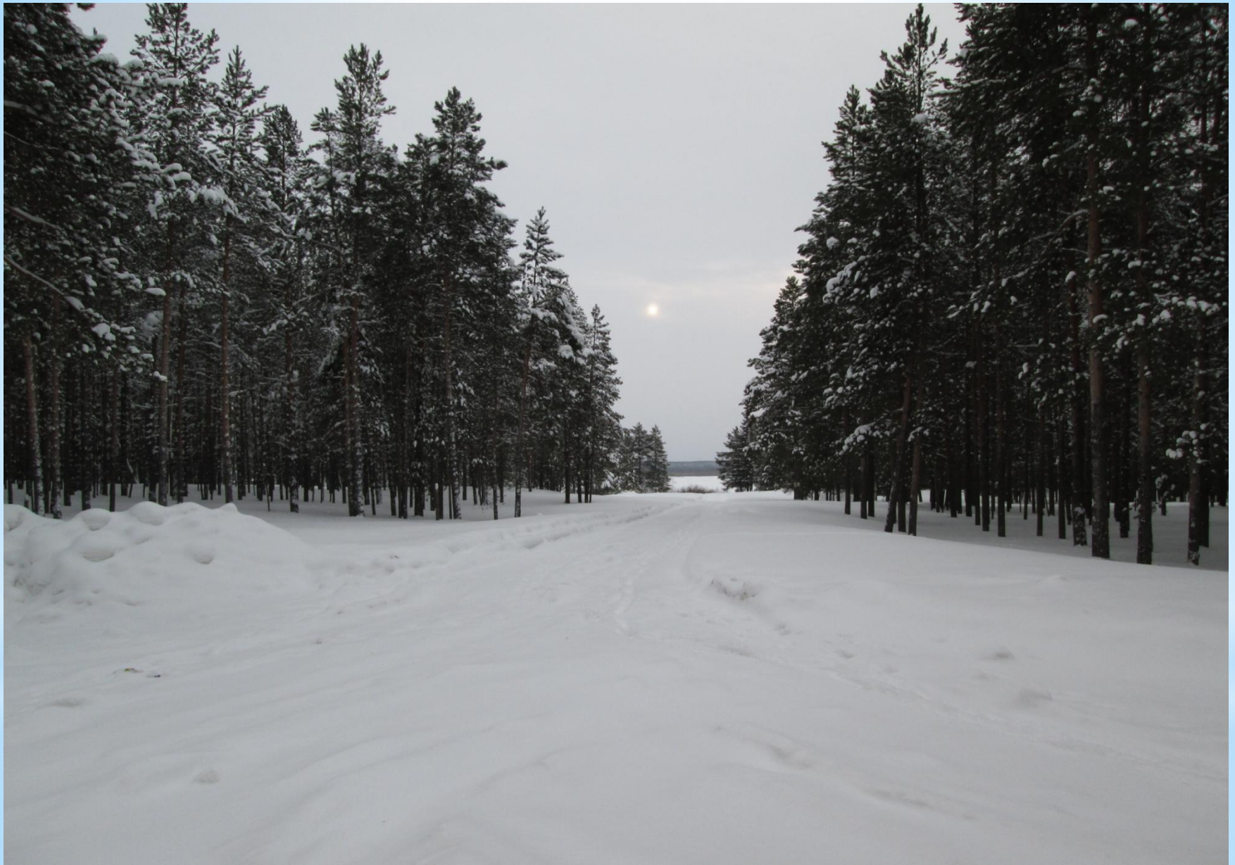
Дорога, которая проходила через Мишка яг и связывала с Усть-Цильмой в зимний Период.