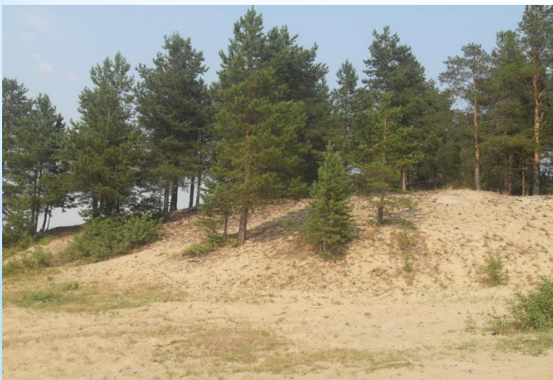
Песчаный берег Мишка яга.

По посещаемости населением Мишка яга был проведен опрос. Из 680 человек Ежегодно посещают Мишка яг 450 человек. Это- различного рода соревнования, Походы, сбор грибов, ягод, прогулки, уборка территории, праздники.