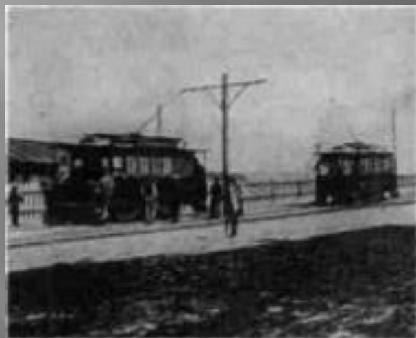
Перші вагони електричного трамвая в Києві