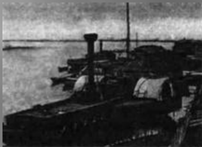
Пароплавна пристань у Кременчуці