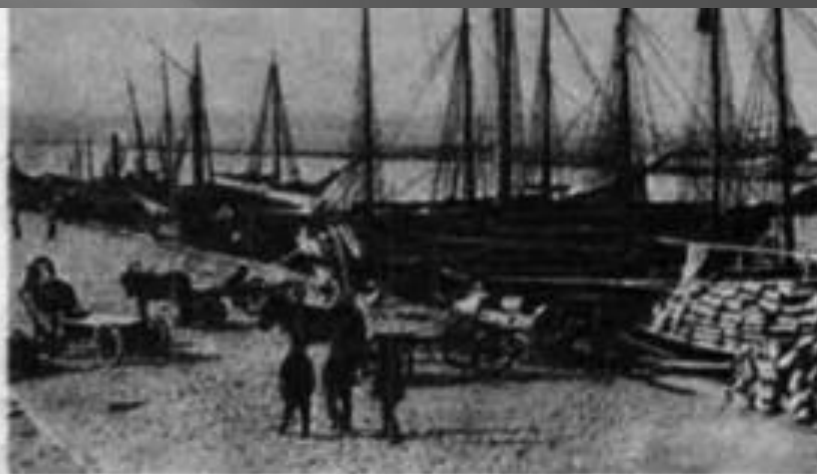
Пароплавна пристань у Маріуполі