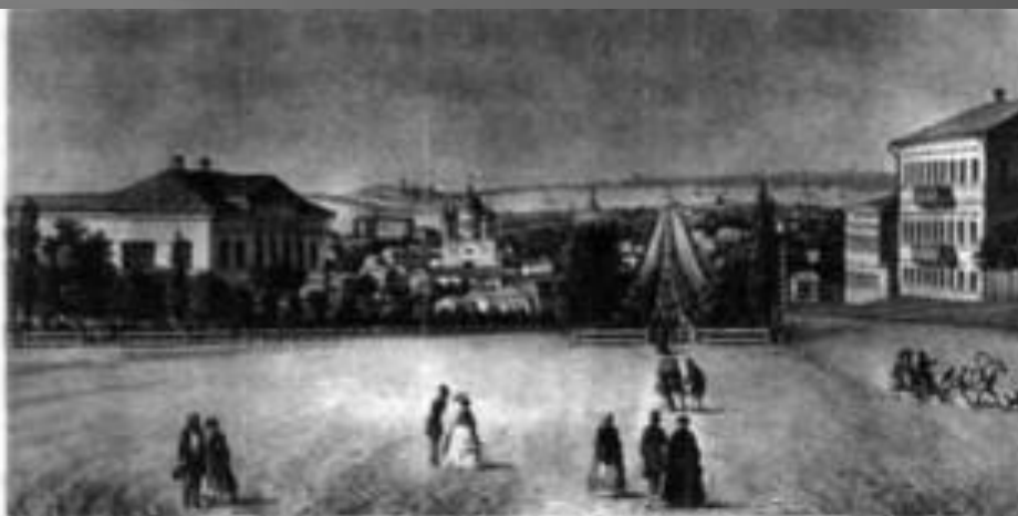
Катерининський проспект у Катеринославі. XIX ст. З гравюри