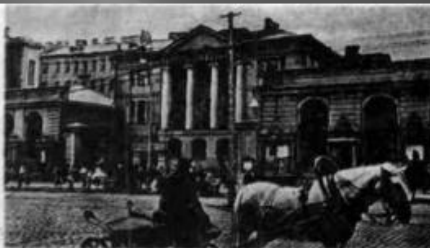
Телефонна станція в Києві