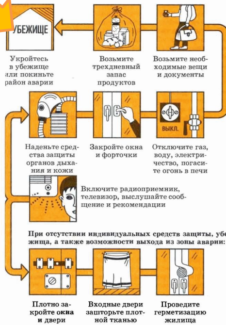
Схема 8 ЧТО НУЖНО СДЕЛАТЬ ПРИ ОПОВЕЩЕНИИ ОБ АВАРИИ С ВЫБРОСОМ АВАРИЙНО ХИМИЧЕСКИ ОПАСНЫХ ВЕЩЕСТВ