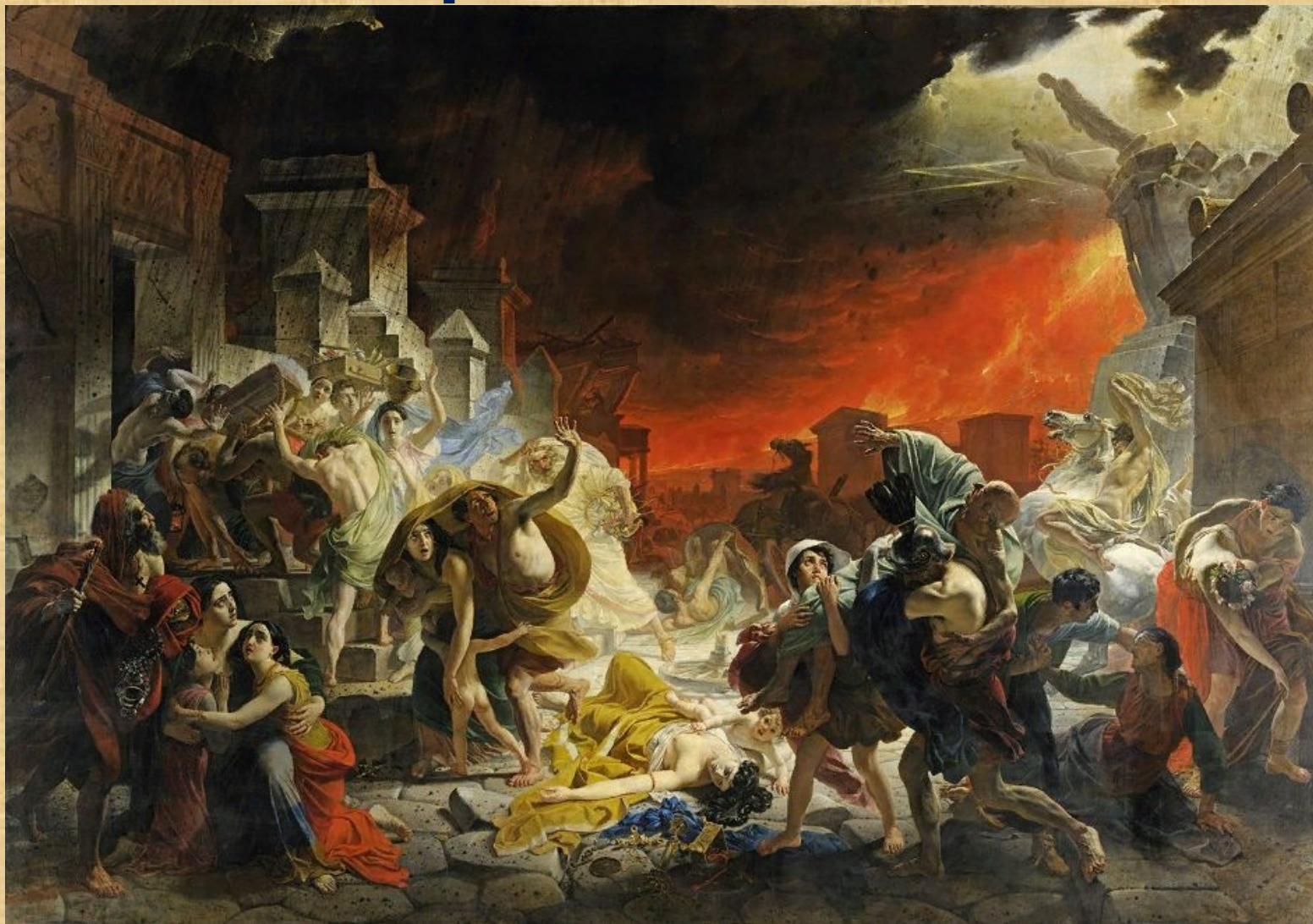
Карл Брюллов Последний день Помпеи