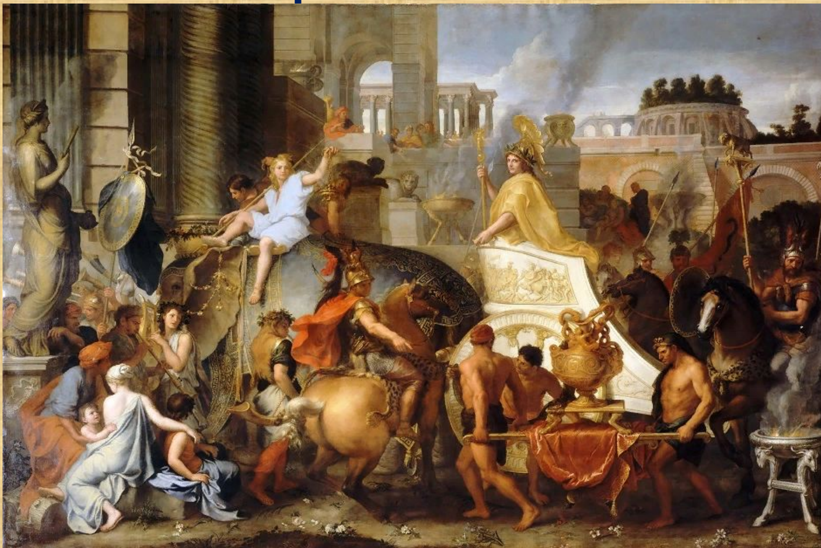
Шарль Лебрэн Вступление Александра в Вавилон