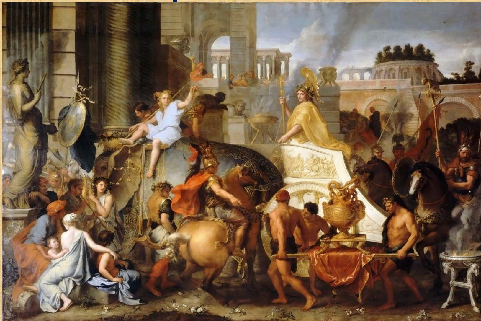
Шарль Лебрен Вступление Александра в Вавилон