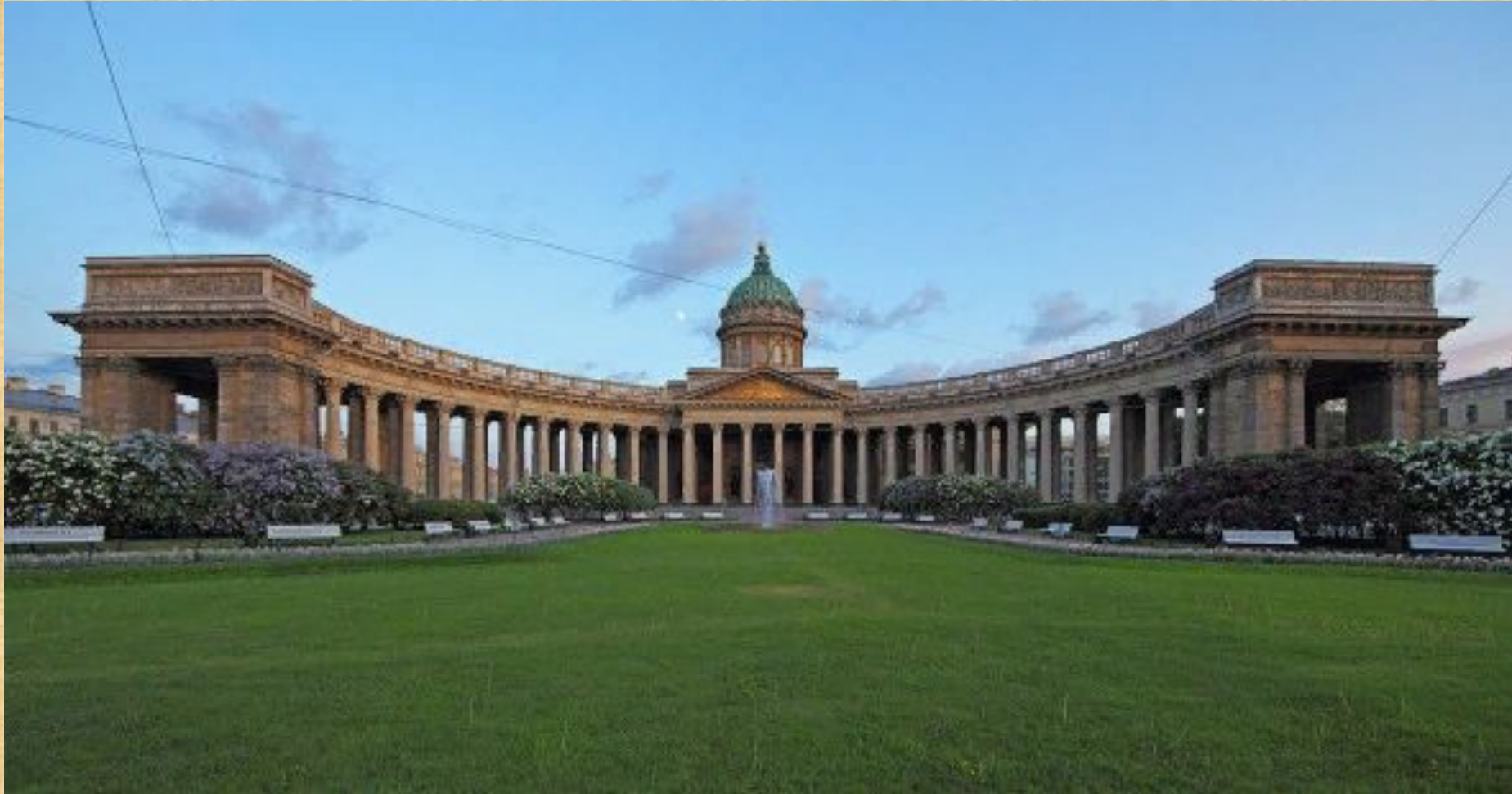
Казанский собор в Санкт-Петербурге