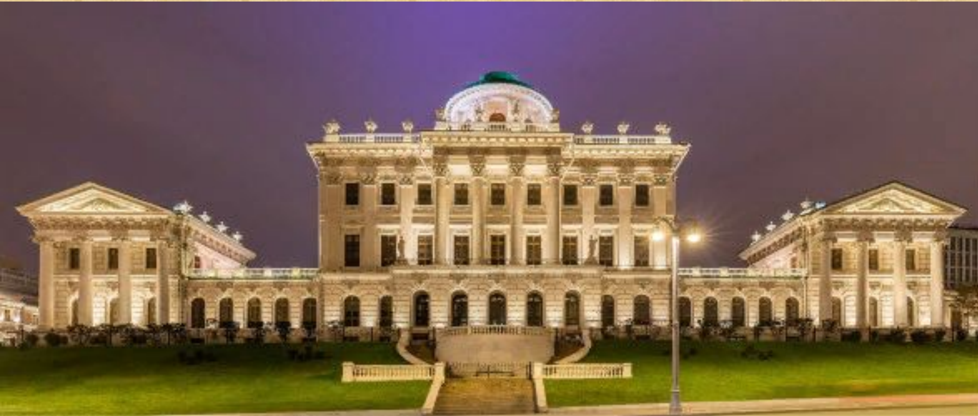
Дом Пашкова (Москва)