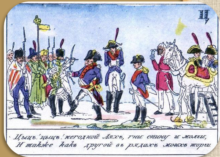
Цыцъ! цыцъ! негодной дьяхъ, гни стапу и жамми, И также какъ другой въ рѣдахъ жонсъ жорги

Легенда — вошедший в традицию устный рассказ, в основе которого лежит чудо, фантастический образ или представление, воспринимающиеся рассказчиком или слушателем как достоверные. Кроме того что они рассказывают интересные истории происхождения того или иного названия, они воспитывают чувство патриотизма, гордости за наш народ.