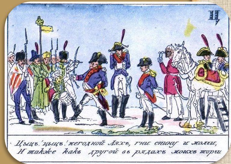
Цыц! цыц! негодной дьяхъ, гдѣ стоиу и жмѣи, И также какъ другой въ рѣдахъ жонсъ жорги

Легенда — вошедший в традицию устный рассказ, в основе которого лежит чудо, фантастический образ или представление, воспринимающиеся рассказчиком или слушателем как достоверные. Кроме того что они рассказывают интересные истории происхождения того или иного названия, они воспитывают чувство патриотизма, гордости за наш народ.