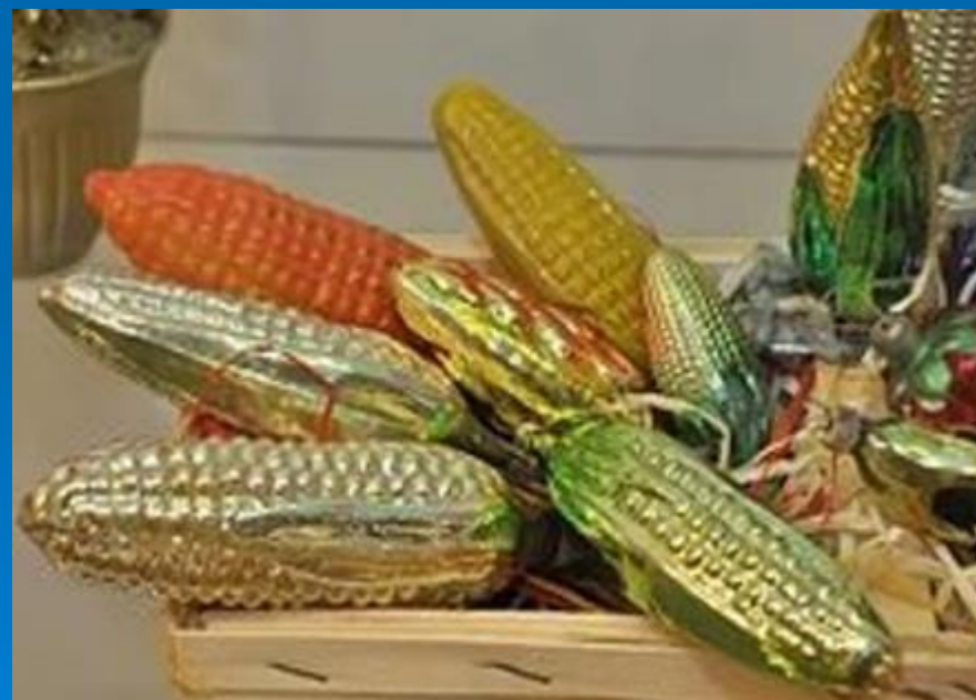
Игрушки, выпущенные в период 1950 – 1970 г.г.