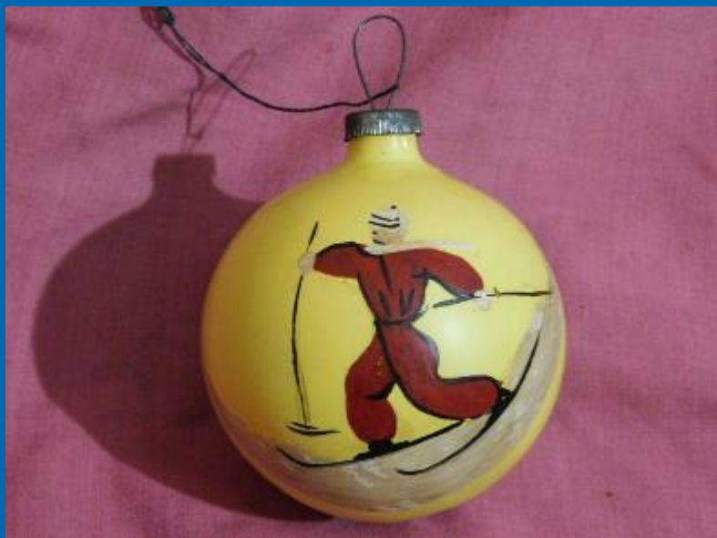
Образец стеклянного шара, производимого фабрикой «Елочка» (1935-1950 г.г.)