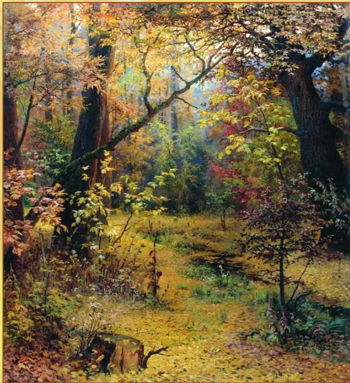
Григорий Мясоедов «Осеннее утро»