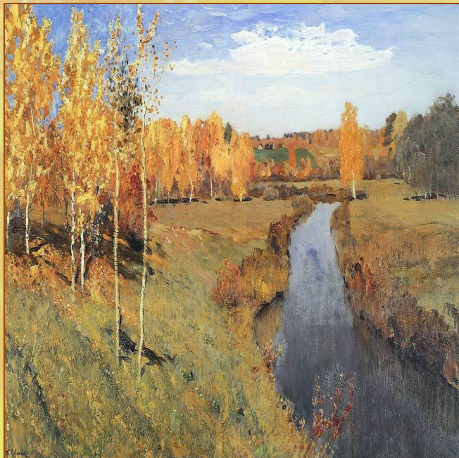
Исаак Левитан «Золотая осень»

И снова осень с чарой листьев ржавых, Румяных, алых, жёлтых, золотых, Немая синь озёр, их вод густых, Проворный свист и взлёт синиц в дубравах. Верблюжья груды облак величавых, Увядающая лазурь небес литых, Весь кругоём, размерность черт крутых, Взнесённый свод, ночами в звёздных славах. Кто грёзой изумрудно-голубой Упился в летний час, тоскует ночью. Всё прошлое встает пред ним воочью. В потоке Млечном тихий бьёт прибой. И стыну я, припавши к средоточью, Чрез мглу разлук, любимая, с тобой.