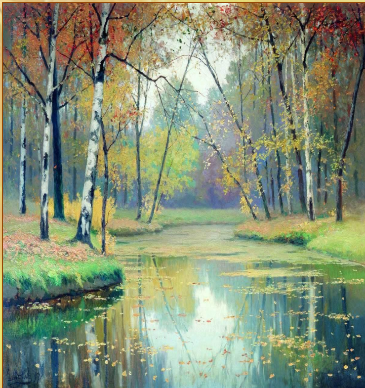
Ефим Волков «Осень»

Унылая пора! Очей очарованье! Приятна мне твоя прощальная краса — Люблю я пышное природы увяданье, В багрец и в золото одетые леса, В их сенях ветра шум и свежее дыханье, И мглой волнистою покрыты небеса, И редкий солнца луч, и первые морозы, И отдалённые седой зимы угрозы. И с каждой осенью я расцветаю вновь; Здоровью моему полезен русской холод; К привычкам бытия вновь чувствую любовь: Чредой слетает сон, чредой находит голод; Легко и радостно играет в сердце кровь, Желания кипят — я снова счастлив, молод, Я снова жизни полн — таков мой организм (Извольте мне простить ненужный прозаизм).