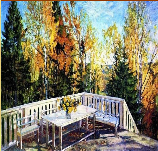
Станислав Жуковский « Осень. Веранда»

Тихо в чаще можжевеля по обрыву. Осень, рыжая кобыла, чешет гривы. Над речным покровом берегов Слышен синий лязг её подков. Схимник-ветер шагом осторожным Мнёт листву по выступам дорожным И целует на рябиновом кусту Язвы красные незримому Христу.