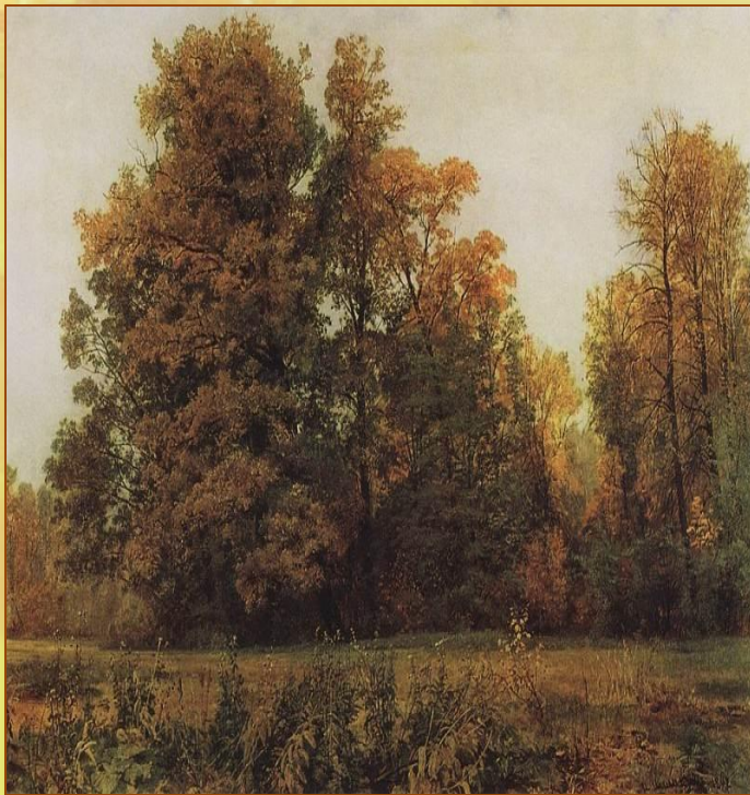
Иван Шишкин «Осень»