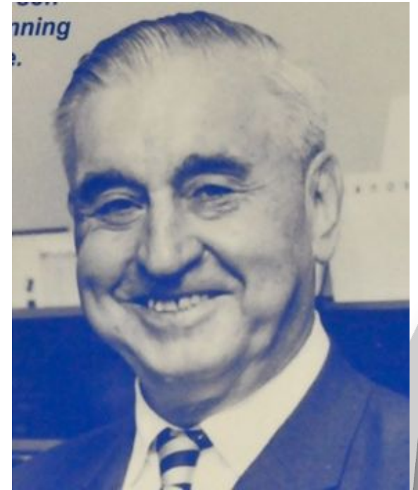
Хомер Хойт (1895-1984)

Особый вклад с теорию секторов, теорию «сырьевой базы» и анализ рынков недвижимости.